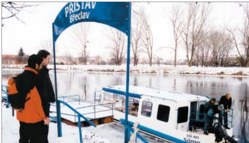
Loď Sámó brázdí od léta řeku Dyji. V prosinci se však změnila v malý ledoborec.

Nejpříjemnější způsob jak zeštíhlit a vytvarovat Vaši postavu po Vánocích pomocí: LYMFODRENÁŽE v kombinaci se zábaelem: - STOP CELULITIDĚ! - Odstranění KŘEČOVÝCH ŽIL! - Úleva OTEKLÝCH nohou a posílení imunity! - Zpevnění břišní stěny a vnitřní strany stehen! RUČNÍ MASÁŽE: - Uvolní ztuhlé svaly, - Uleví od bolesti. Těšíme se na Vás ve studiu ANNA MARIA v Poštorné (Dům barev). Objednávky a případné informace na tel.: 0604/202 837