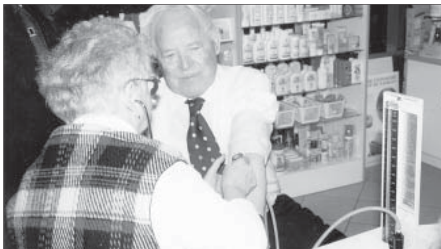
V Přírodní lékárně pro zdraví a krásu v břevclavském Shopping centru si cukrovkáři mohli nechat změřit tlak a cukr v krvi.