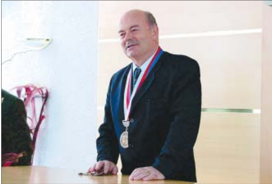
Starosta města Mgr. Miroslav Ondruš přeje všem občanům města klidný a šťastný rok 2002.