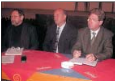
Vedení radnice uspořádalo v březnu besedy s občany jednotlivých městských částí.

Termíny besed byly vybrány záměrně před konáním zastupitelstva města, které 26. března rozhodovalo o rozpočtu města na rok 2001. Některé připomínky mohly být takto zapracovány přímo do rozpočtu. S účastí od 10 do 25 občanů v jednotlivých městských částech byl starosta spokojen, protože se jednalo o obyvatele, jimž není dění ve městě lhostejné a řadou připomínek naznačili vedení města, co z jejich pohledu je nejvíce důležité. Jednalo se např. o údržbě zeleně, stavu komunikací a veřejného osvětlení, městské hromadné dopravě, čistotě města, stavu některých kulturních památek atd. Porovnat splnění či řešení těchto problémů slíbilo vedení radnice na příštích besedách s občany, které se uskuteční v měsíci říjnu, kdy lze opět některé požadavky zahrnout do připravovaného rozpočtu města na další rok. Přesný termín besed s občany bude zveřejněn ve zpravodaji „Radnice“.