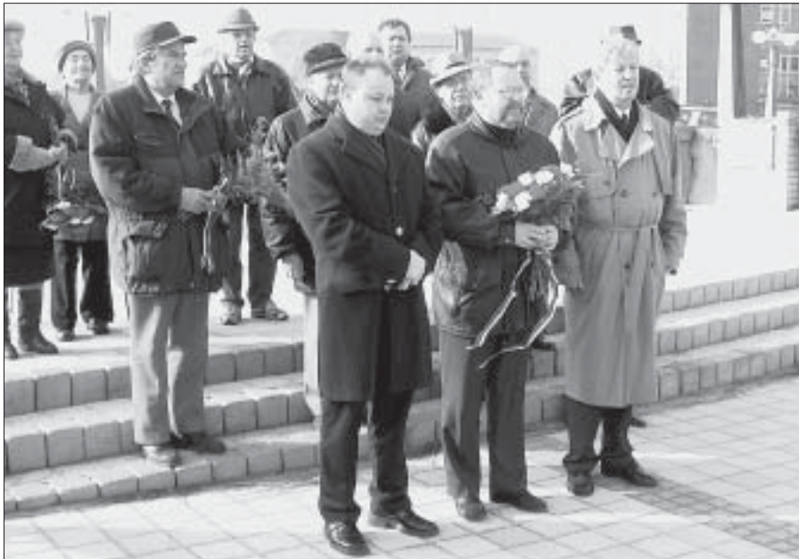
POLOŽILI VĚNCE. V úterý 6. března položili představitelé radnice a Okresního úřadu Břeclav věnce u památníku prvního prezidenta republiky T. G. Masaryka u ZŠ Dukelská (Žlutá škola) při příležitosti jeho 151. výročí narození.