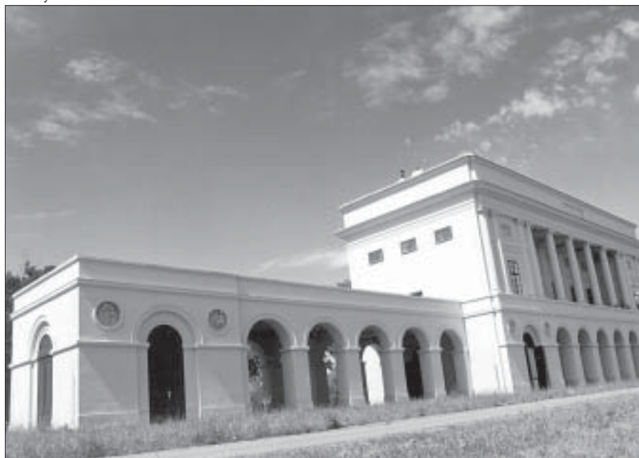
Zámeček Pohansko také letos přivítá stovky účastníků akce Pohanské hrátky.