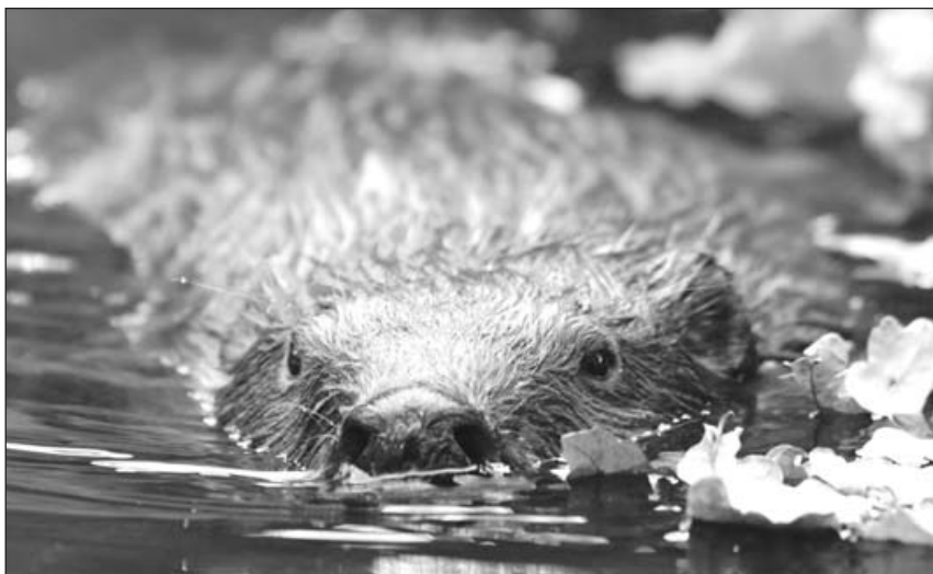
Hráz ve Staré Břeclavi, kterou poškodili bobři, je už opravená.

Jak dodal, na základě mimořádné technicko-bezpečnostní prohlídky pak zástupci Povodí Moravy zjistili, že situace je