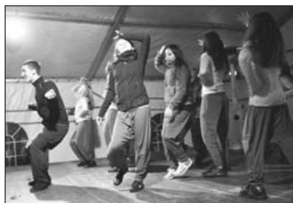
Actiivity DC zaujali i návštěvníky vánočních slavností v Břeclavi.

Dohromady šest medailí si ze soutěže v Písku přivezla breclavská taneční skupina Actiivity DC. Do soutěže se přitom mohl přihlásit kterýkoliv taneční klub z České republiky. Tanečníci Actiivity DC bojovali v několika kategoriích. Soutěž hostila na osmdesát choreografií různých tanečních stylů. Břeclaváci uspěli ve všech věkových kategoriích, od dětí až po seniory. Kromě zlatých a stříbrných