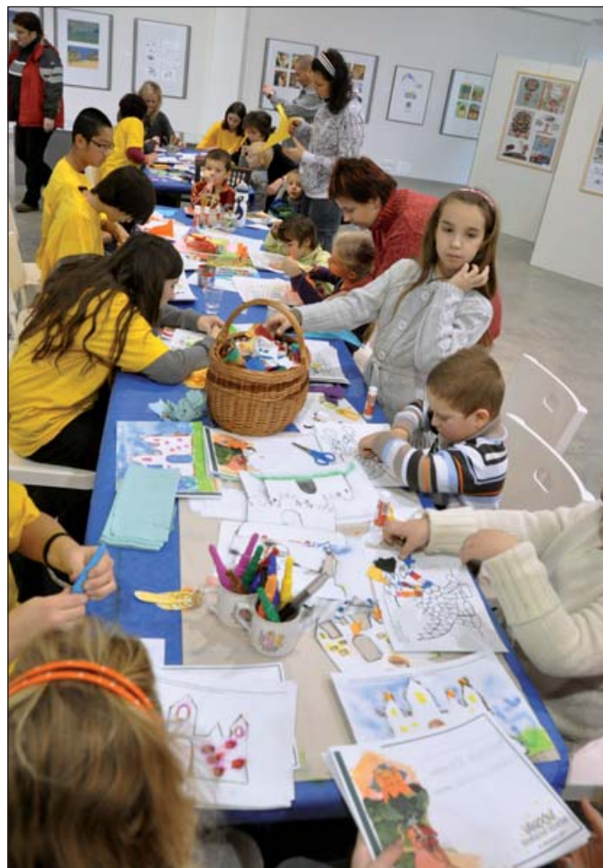
Vánoční dílnička měla u dětí úspěch.