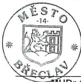
MUDr. Oldřich Ryšavý starosta Města Břeclav