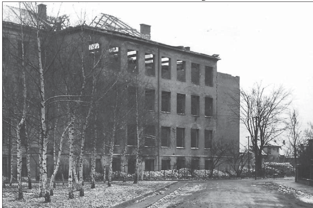
Zničená budova školy mlynářské, pekařské a živnostenské na Komenského nábřeží v Břeclavi.

I když v Břeclavi převažovalo naprosto české obyvatelstvo, Břeclav byla zařazena mezi obce tzv. pátého pásma a 8. října 1938 v odpoledních hodinách obsazena. Po oznámení dva dny před osudovým datem, že bude zabrána, na breclavských středních školách se spěšně balilo, především úřední spisy, ale i některé zařízení laboratoří, při čemž pomáhali i studenti. Tato práce byla ukončena ráno v sobotu 8. října, a tak v 10 hodin odjízďeli profesori, ale i studenti místních středních škol posledním evakuačním vlakem do Hodonína.