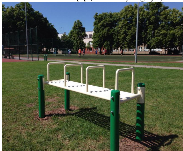
Lavice s úchyty (ilustrační fotografie)