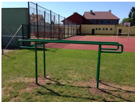
Bradla (ilustrační fotografie)