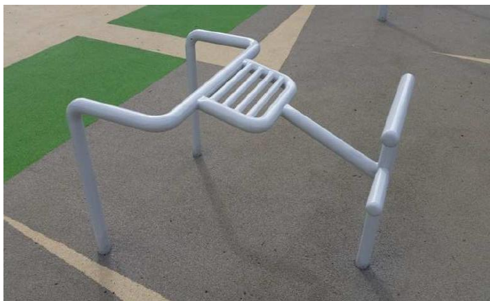
Lavice na posilování zad (ilustrační fotografie)