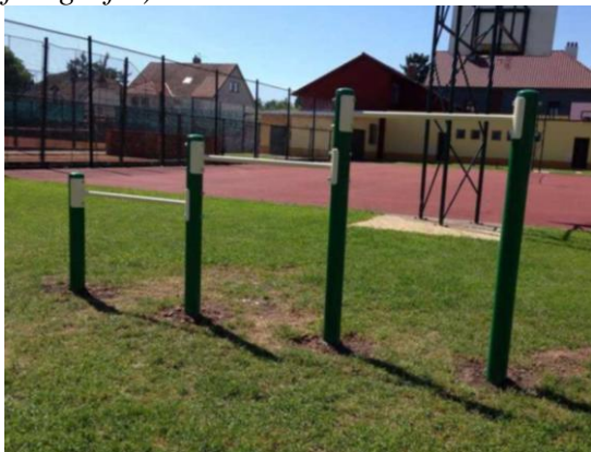
Malá trojitá hrazda (ilustrační fotografie) fotografie)