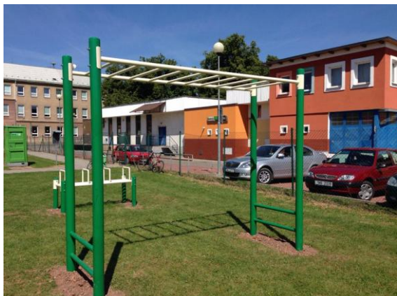
Žebřík na ručkování (ilustrační fotografie)