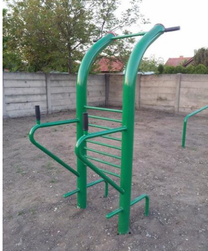
Hrazda s bradly a opěrkou (ilustrační fotografie)