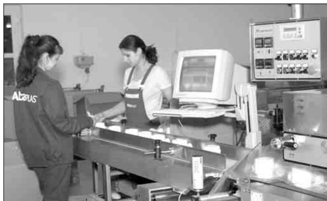
Společnost má v současné době 140 zaměstnanců. Po zahájení provozu nové haly vzroste jejich počet na 170.