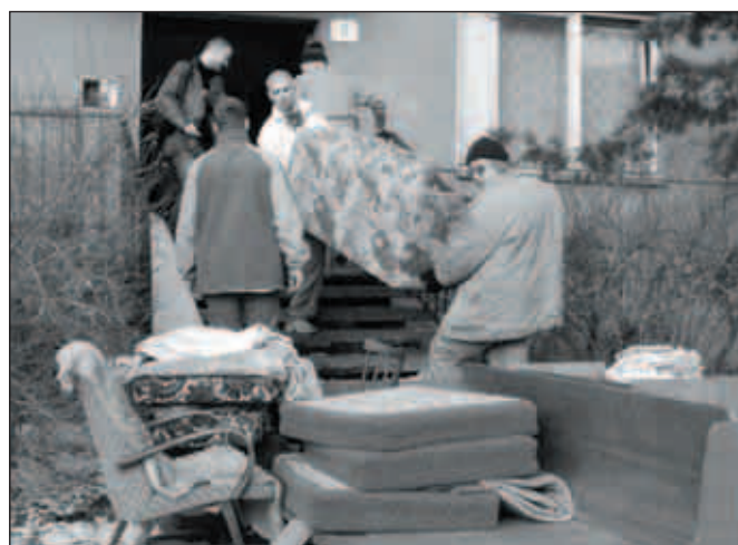
Výzvě k okamžitému vystěhování nechtěl ani jeden z dlužníků uvěřit.

Hospodaření loňského roku skončilo přebytkem 25 milionů korun. Celkové příjmy dosáhly 563 a výdaje 538 milionů korun. Díky optimalizaci majetku, uvážlivému hospodaření a řadě dalších pozitivních kroků může město i v letošním roce investovat. Z vlastních zdrojů město proinvestuje bezmála 36 milionů korun a dalších 28 milionů plánovaných investic představují státní dotace. Rozpočet na rok 2004 je v podstatě stanoven jako vyrovnaný. Příjmy by měly dosáhnout 534 milionů a výdaje 530 milionů korun, prozatím bez započítaných, výše uvedených státních investičních dotací.