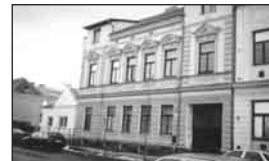
01096 BŘECLAV bytový dům poblíž centra ..... 2,65 mil. Kč

NABÍDNĚTE – Hledáme pro naše klienty rod. domky a byty v Břeclavi a okolí ROZŠÍŘENÁ NABÍDKA na http://www.slaviark.cz/