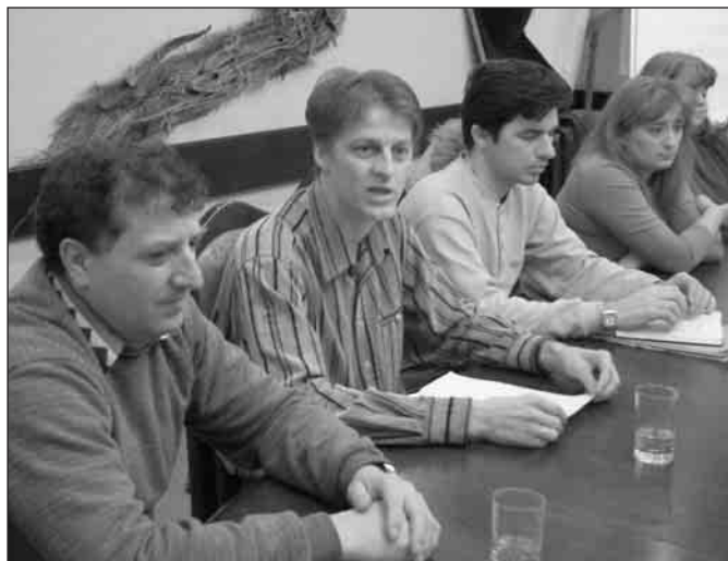
Zatímco společně nabyté akcie Ladenští požadují, na společných závazcích se podílet nechtějí.

Na základě kladného výsledku místního referenda o oddělení městské části Ladná od Břeclavi odeslalo město krajskému úřadu návrh na oddělení části obce. Návrh obsahuje základní body vypořádání - datum oddělení, vymezení území nově vznikající obce, rozdělení majetku, závazků, právnických osob a organizačních složek obce, způsob stanovení počtu občanů a rozdělení výnosu daní.