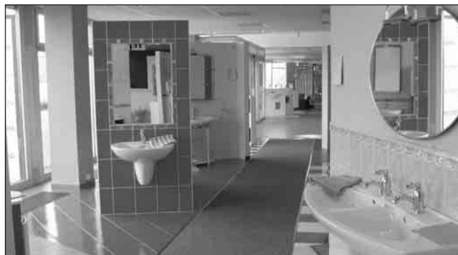
ALCA PLAST má na ploše 700 m 2 největší koupelňové studio na jižní Moravě.

ALCA PLAST vyrábí od roku 1998 na Bratislavské ulici vany a vaničkové sifony, WC armatury a další sanitární techniku. Od roku 2001 zde společnost otevřela moderní koupelňové studio a velkoobchod s instalačním materiálem. Firma si během poměrně krátké doby vybuodovala silnou pozici nejen na českém a slovenském, ale i evropském trhu. V současné době dodává své výrobky do Maďarska, Lotyšska, Litvy, Estonska a chystá se na trh evropské unie.