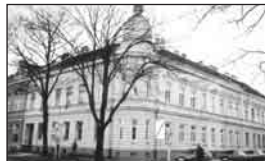
01091 BŘECLAV bytový dům poblíž centra ..... dohodou