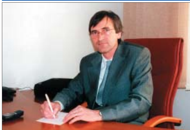
Senátor Vladimír Schovánek ve své nové kanceláři v Břeclavi.