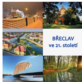
BŘECLAV ve 21. století

Kniha je rozčleněna do čtyř kapitol. Břeclav změněná ukazuje stavby z posledních let, ale i opravené historické budovy. Břeclav