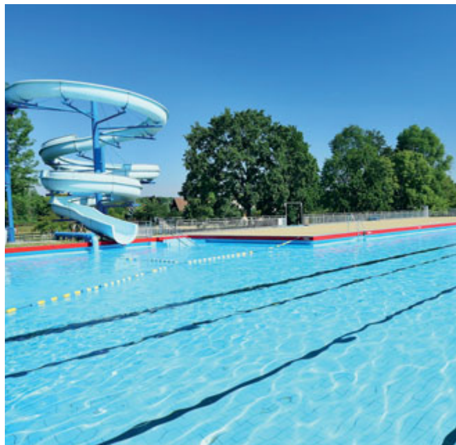
Břeclavané se vyjádřili ve veřejném fóru a následné anketě. Z hlasování mimo jiné vyplynulo, že chtějí rekonstrukci krytého bazénu a koupaliště.

„Dlouhodobou prioritou je pochopitelně stavba obchvatu kolem Břeclavi, od kterého všichni čekáme úlevu v podobě snížení dopravní zátěže ve městě. Když dáme dohromady hlasování lidí, kteří přišli diskutovat v září a hlasování těch, kteří se zúčastnili vyhlášené ankety, jednoznačně se potkali na potřebě rekonstrukce krytého bazénu a koupaliště. Uvědomujeme si, že oproti okolním městům tady máme opravdu dluh a připravujeme podklady pro dotační tituly, které by nám rekonstrukci umožnily, protože to bude finančně náročná záležitost,“ shoduje se vedení města. „Také další zmíněná témata nejsou žádnými novinkami, na některých už pracujeme – například příprava na revitalizaci