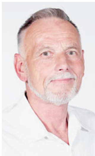
Vážený obyvatelé Břeclavi,

I přes opravdu horké letní počasí pokračovaly v Břeclavi stavební práce o prázdninách naplno. V Radnici se tak dočtete o let-