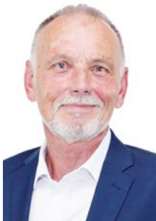
Vážení obyvatel Břeclavi,

rekonstrukce areálu koupaliště je u konce. Věřím, že všechno půjde, jak má, i při finálních úpravách a na začátku letních prázdnin pro vás nový břeclovský koupák otevřeme. Otevření plánujeme na 1. července