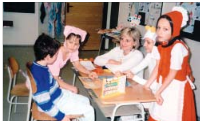
Zápis na ZŠ Břeclav, Sovadinova, probíhá netradičně.

Zveme srdečně všechny děti narozené od 1.9.1995 do 31.8.1996 k netradičnímu zápisu do 1. tříd. Koná se ve čtvrtek 7. února v době od 13 do 18 hodin. Na všechny se těší učitelé a ředitel školy.