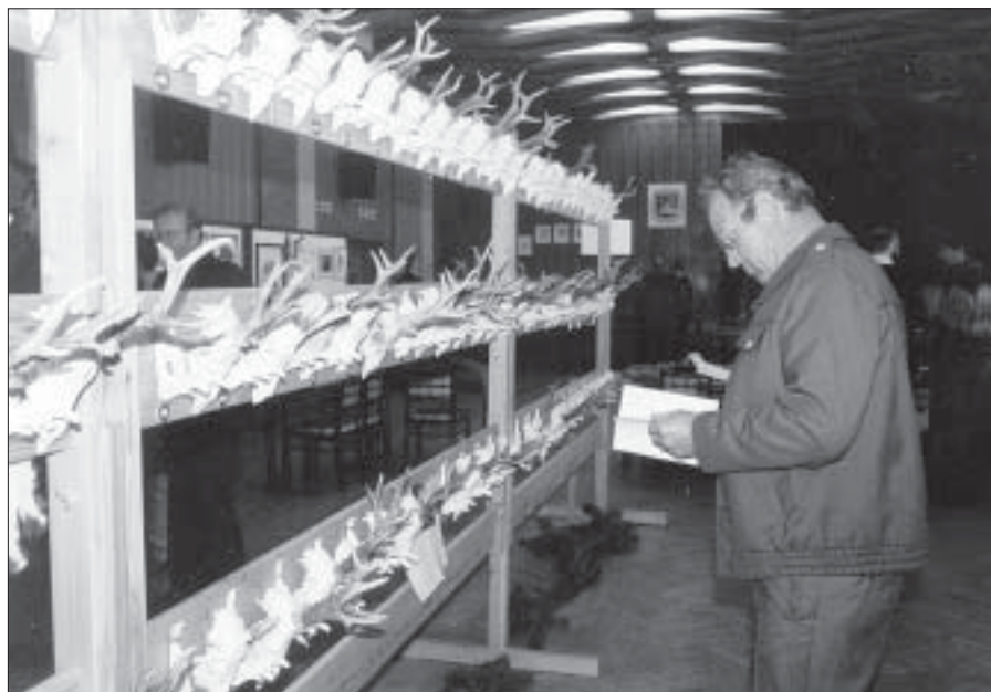
Diskuse nad některými parohy či parůžky na přehlídce loveckých trofejí v Břeclavi často nebraly konce.