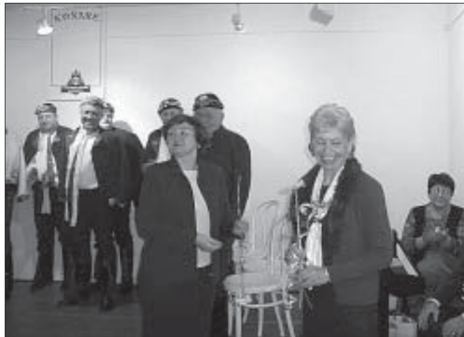
Náš Jan Skácel - závěr pořadu.

Tiskopisy přihlášek s podmínkami účasti mohou zájemci získat v městské knihovně buď v hlavní budově na ulici Národních hrdinů ve městě nebo v pobočkách knihovny v Poštorné, Charvátské Nové Vsi, Ladné a Staré Břeclavi (telefonní čísla jsou uvedena na zadní straně Radnice). Vyplněné přihlášky je třeba odevzdat na uvedených místech v knihovně do 10. května t.r. Přihlášení zájemci budou potom pozváni na pracovní schůzku, na níž bude projednána organizace i obsahová náplň celého vzdělávacího cyklu. Blíží informace poskytnete zájemcům ředitelka knihovny na telefonním čísle 372 437.