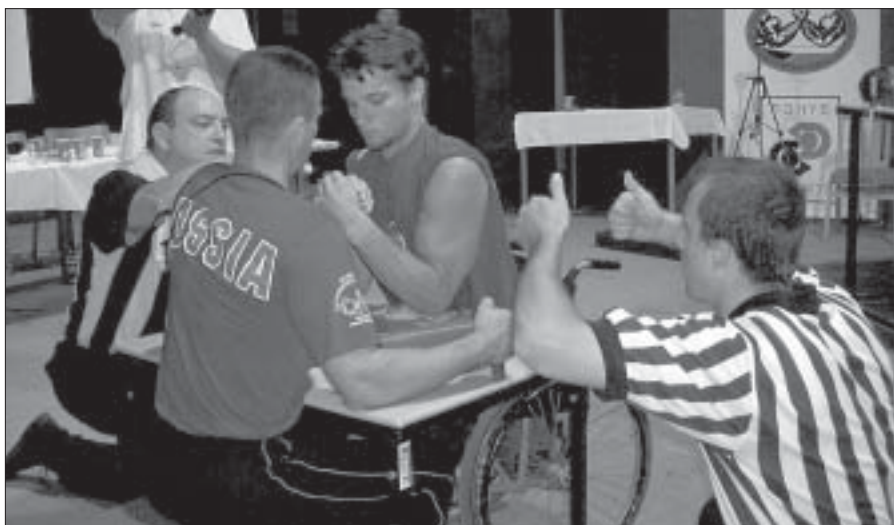
Do Břeclavi přijela i sto čtyřicetiletá ruská delegace siláků. Mezi závodníky byli také vozíčkáři.

Tzv. armsport neboli přetlačení rukou si v posledních letech získává stále větší počet zájemců o tento nezvyklý druh sportu. I když přízněji si, že páku si v životě zkusil snad každý z nás. Česká asociace přetlačení rukou povýšila tuto chlapeckou zábavu na profesionální úroveň a dnes se armsportu věnují jak muži, tak ženy. V breclavském domě kultury se po několik dnů střídali siláci z osmdesáti zemí Evropy (na poslední chvíli se přihlásila sto čtyřicetiletá ruská delegace). Siláci obsadili nejenom kulturní dům, ale taky prakticky všechny ubytovací kapacity v Břeclavi a okolí. Bojovníci z okresu Břeclav v této silné konkurenci získali pět medailí (jednu stříbrnou a čtyřikrát bronz). (peh)