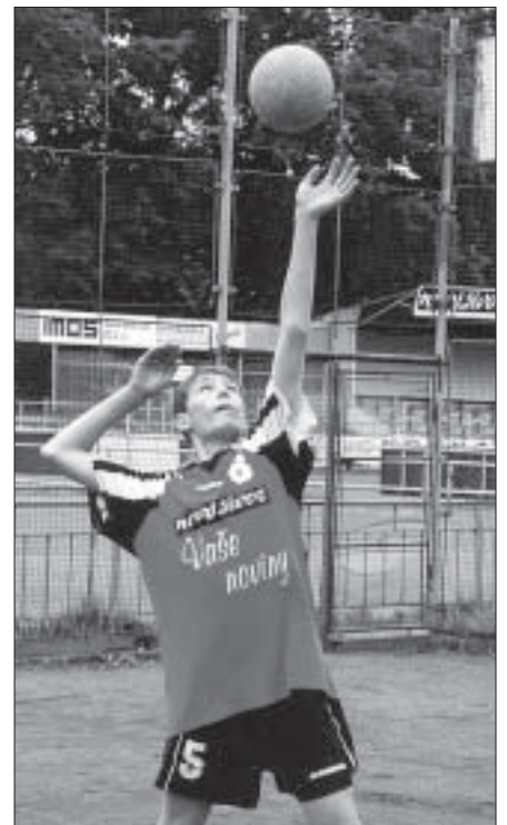
Domácí Vilda v turnaji žáků ve volejbale na kurtech Tatraru Poštorná.

Za oddíl volejbalu Tatraru Poštorná Milan Tomášek