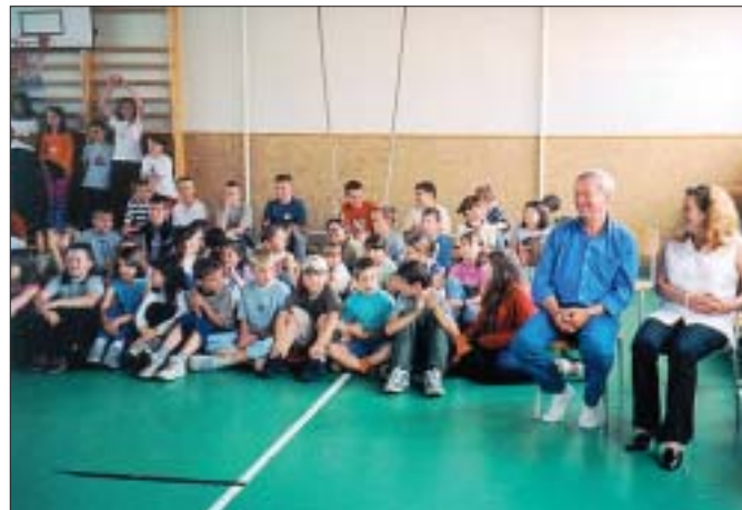
Naše děti i jejich rakouští kamarádi pozorně naslouchali, přihlížel ředitel a učitelé z zwentendorfské školy.