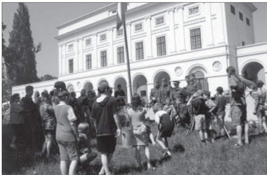
O Pohanské hrátky, které se konají každoročně v rámci zahájení turistické sezony u zámku Pohansko, bývá vždy obrovský zájem. Letošní hrátky přijeli oživit členové klubu vojenské historie z Brna.