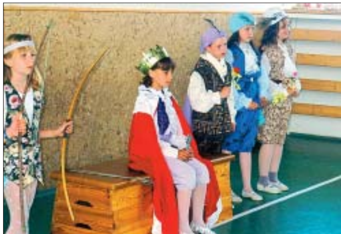
Děti z Duhové školy připravily pro své rakouské kamarády a kamarádky z Zwentendorfu i divadelně ztvárněnou pohádku.