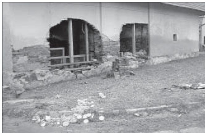
Takhle to vypadalo po letošních záplavách v Olešnici na Blanensku.

Po několika dnech přijíždí do Olešnice druhá skupina dobrovolníků, která se soustředí na sanaci navlhlého zdiva. Přiváží hračky, které darovalo farní společenství matek z Hustopečí a polštářky, které vlastno-