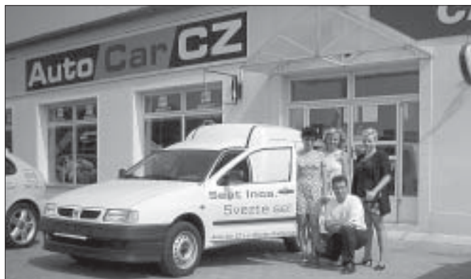
Také břeclavská firma Auto-Car a.s. zapůjčila charitě jeden ze svých vozů Seat pro rozvoz humanitární pomoci pro postižené Čechy.

Do oblastí postižených povodněmi v jižních a severních Čechách již Oblastní charita Břeclav vypravila několik kamionů s humanitární pomocí. Práce jsou koordinovány s referátem obrany a ochrany Okresního úřadu v Břeclavi a charita je rovněž ve spojení se sklady v postižených oblastech a operativně tak reaguje na aktuální potřeby. Pomoc by nebyla možná v takovém rozsahu, kdyby se na ní kromě pracovníků charity nepodílela řada dobrovolníků a firem. Například firmy Nisan z Hodonína, Auto-Car a.s. Břeclav (SEAT), Alimex ČR a AAA auto Praha zapůjčily charitě automobily potřebné pro rozvoz humanitární pomoci. Auto s řidičem i pohonnými hmotami zapůjčila také břeclavská firma DUCAR pro odvoz humanitární pomoci do skladu v Litoměřicích. Další auto zapůjčila firma IPI Rakvice - Trkmanice, která věnovala rovněž větší množství pracího prášku. Tiskárna Grafotisk v Břeclavi