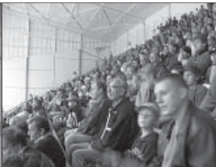
Stav, který nikoho na zaplněné tribuně nenechal chladným. Diváci v zápase české reprezentace s Ruskem dokázali vytvořit opravdový „kotel“.