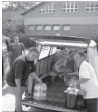
Dobrovolníci z Pohřební služby Kelemen nakládají humanitární pomoc. Firma zapůjčila auto s pohonnými hmotami.

Oblastní charita Břeclav letos už podruhé organizuje rozsáhlou pomoc zaplaveným obcím. Nejprve v červenci pomáhala po povodních na Blanensku a když udeřily rozsáhlé povodně v Čechách, zorganizovala ještě mnohem větší humanitární pomoc.