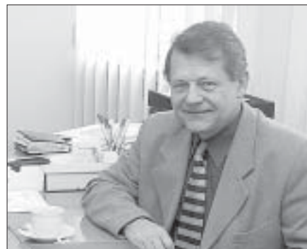
• V pondělí 23. září přivítalo vedení města na radnici poslance Parlamentu ČR Ladislava Šustra (KDU - ČSL).