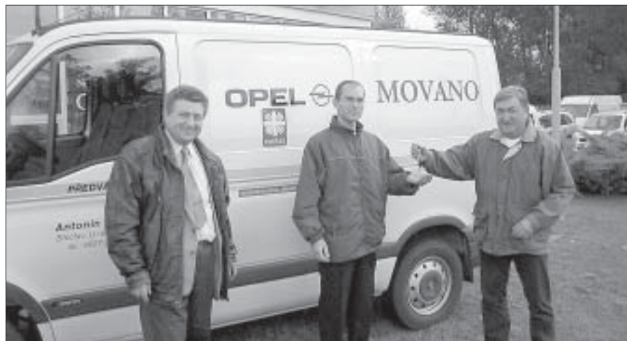
Firma Opel Nešpor v Břeclavi zapůjčila Oblastní charitě Břeclav pro účely humanitární pomoci v oblastech postižených povodněmi automobil Opel Movano.