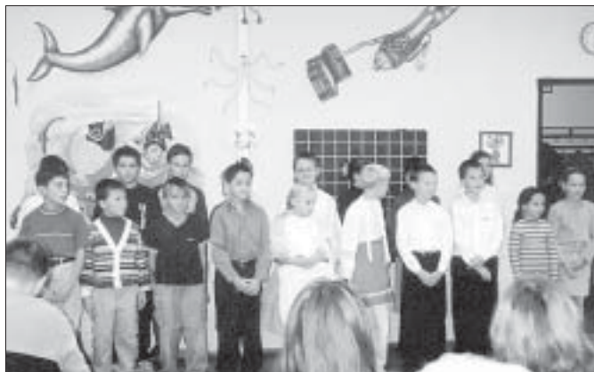
Děti ze ZŠ Jana Noháče ve Staré Břeclavi při vystoupení k besedě prof. Jaroslava Školla - „Osobnosti kulturní historie Staré Břeclavi“.

Pořad se uskuteční v pátek 29. listopadu 2002 v 18.00 hod. v hudebním oddělení knihovny ve městě na ulici Národních hrdinů 9.