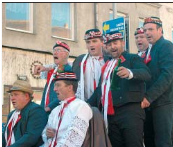
Ozdobou letošních Břeclavských svatováclavských slavností byly krojované chasy ze všech čtyř městských částech, které přijely na povozech tažených koňmi.