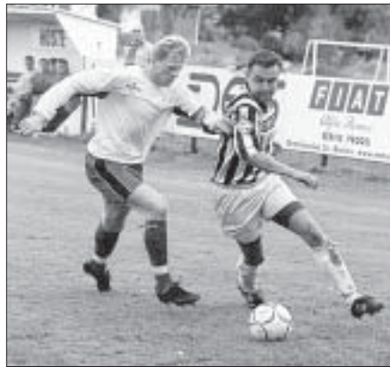
SLOVAN BŘECLAV - LIPOVÁ 1:1

Tradiční hodové utkání v kopané mezi Starou Břeclaví a hosty pořádá v sobotu 9.11. od 10.00 hod. občanské sdružení OLYMPIA Stará Břeclav. Hraje se na Pastvisku, počet hráčů v družstvech je neomezený. Registrace hráčů je v 9.30 hod., pořadatelé by rádi uvítali překonání celkového počtu 42 hráčů z r. 1998. Součástí utkání bude focení hráčů na kalendář OLYMPIE na r. 2003. Občerstvení jak na hřišti, tak na následném hodovém posezení s cimbálovou muzikou od 13.00 hod. v hostinci Na obecní je zajištěno.