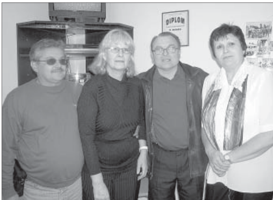
V sobotu 12. října otevřel Spolek neslyšících Břeclav svoji klubovnu v Charvátské Nové Vsi, na kterou čekal pětadvacet let.