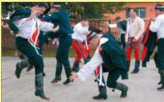
Charvátská Nová Ves.