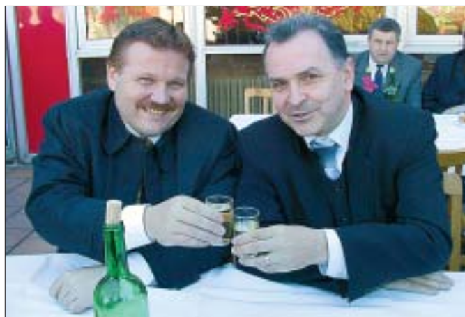
Pod májů na Břeclavských svatováclavských slavnostech se sešli hejtman Jihomoravského kraje Stanislav Juránek (KDU-ČSL, vpravo) a ministr práce a sociálních věcí Zdeňk Škromach (ČSSD, vlevo). Při skleničce dobrého vína zavládla dobrá nálada.