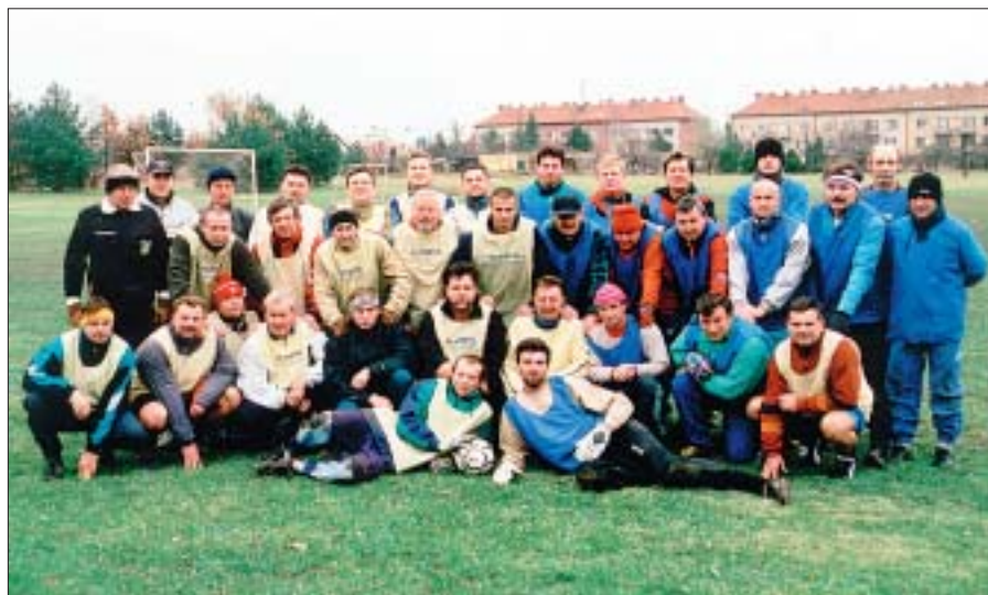
Hodová kopaná ve Staré Břeclavi.