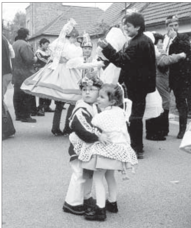
HODY V POŠTORNĚ. Snímek Jaroslava Kicla se vracíme k podzimním krojovaným hodům v Poštorné, kde si zatancovali nejen šohaji a děvčice, ale i děti, které je jednou v krojích vystřídají.