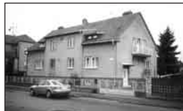
01080 - ST. BŘECLAV - RD 5+1, zahrada, pozemek celkem 632 m 2 .....2,2 mil. Kč