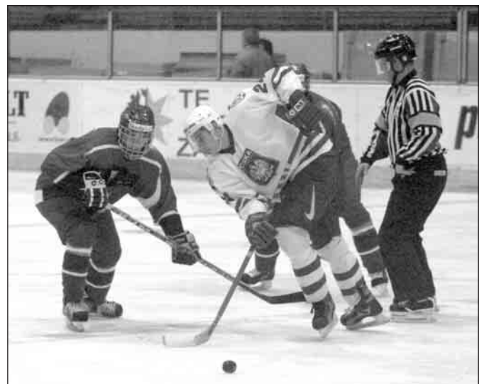
Přípravné utkání na nadcházející mistrovství světa v ledním hokeji se hrála na břeclavském ledě česká reprezentace do 18 let. Zápas proti výběru Polska do 20 let si přišlo vychutnat zhruba 700 diváků. Celkem 15 gólů svědčí o tom, že se skutečně bylo na co dívat. Naši mladí reprezentanti hráli jako vždy pohledný hokej a o dva roky starší Poláci vyprovodili s vysokým rozdílem 13:2.

Akce „Na kole Lednicko-valtickým areálem“ aneb „Po stopách Lichtenštejnů“, uvedená v Kulturním kalendáři města Břeclavi pod datem 8. května 2004, se letos z technických důvodů neuskuteční. Děkujeme za pochopení. Organizátoři akce