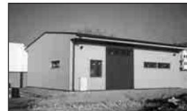
01010 - BŘECLAV - nová hala 102 m 2 , kancelář 11 m 2 ..... 11 260 Kč/měs.

NABÍDNĚTE - Hledáme pro naše klienty rod. domky a byty v Břeclavi a okolí ROZŠÍŘENÁ NABÍDKA na http://www.slaviark.cz/