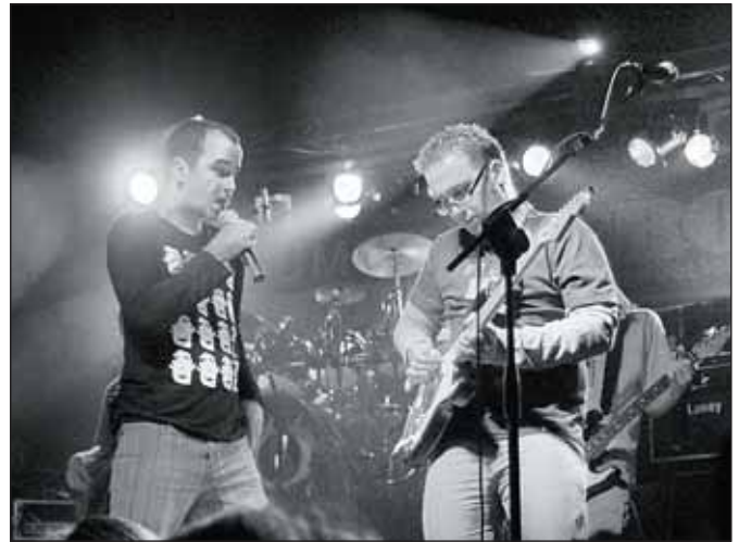
Hlavní hvězdou večera byla slovenská kapela No Name

Již nyní se příznivci rocku mohou těšit na 3 ROCK v Besedě, který se uskuteční pravděpodobně 6. listopadu. Pořadatelé hodlají nabídnout publiku možnost výběru hlavní kapely večera. (pk)