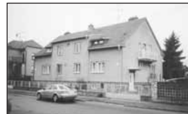
01080 BŘECLAV – RD 5+1, zahrada .....2,2 mil Kč