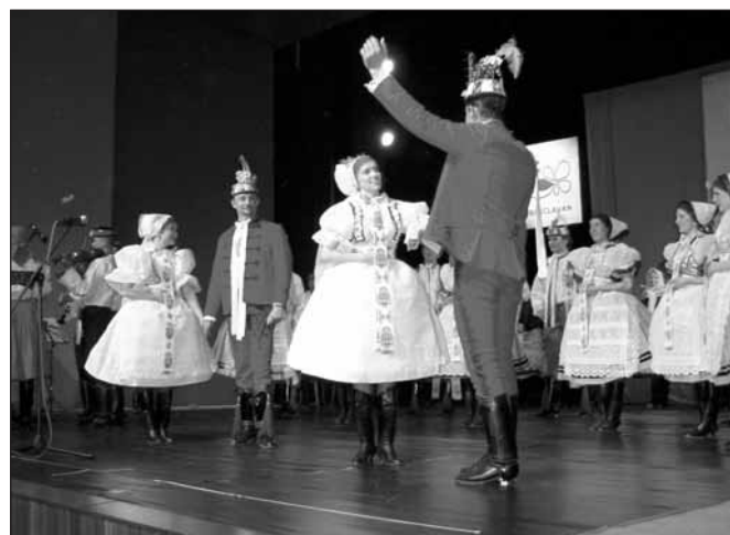
Národopisný soubor Břeclavan si připomněl 50. výročí svého vzniku v sobotu 8. května na jevišti břeclavského domu kultury premiérovým koncertem s názvem „...tož, načneme druhou padesátku“. Na snímku je záběr z Podlužácké svatby, v níž vystoupilo několik břeclavských generací.

Pro veřejnost otevřeno: pondělí, čtvrtek 8 – 11 13 – 18 úterý, středa, pátek 13 – 18