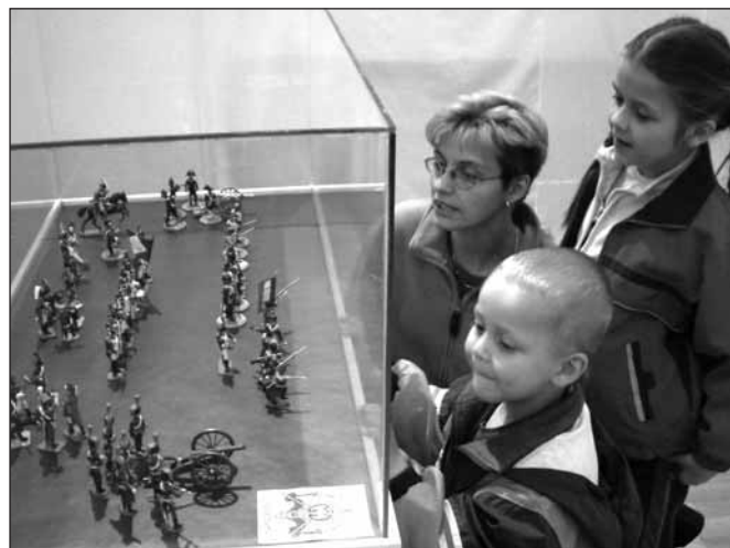
Přes 150 exponátů si mohou prohlédnout návštěvníci výstavy Chladné zbraně 19. a 20. století v městském muzeu. Vystaveny jsou i ukázky dobových uniforem, medailí, vyznamenání a ostatních militárií. Za shlédnutí jistě stojí i sbírka cínových vojáčků – bitva u Slavkova.

Můžete nás navštívit každý den kromě pondělí od 9.00 do