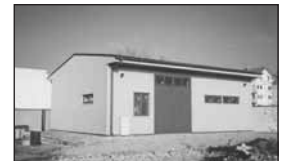
01010 BŘECLAV – pronájem nové haly 112 m 2 ...9 400 Kč/měs

NABÍDNĚTE – Hledáme pro naše klienty rod. domky a byty v Břeclavi a okolí ROZŠÍŘENÁ NABÍDKA na http://www.slaviark.cz/