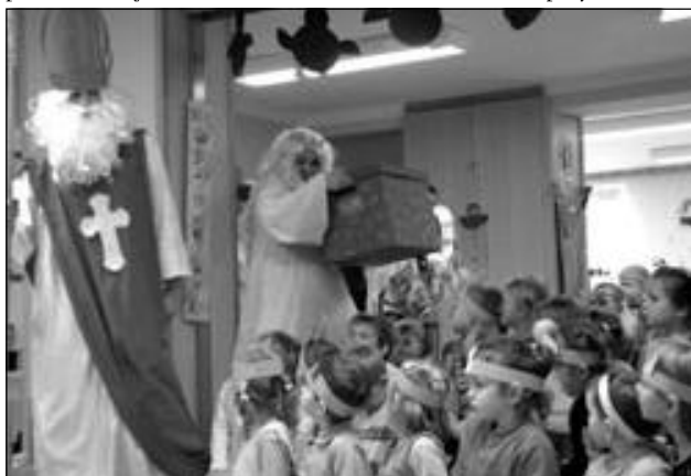
Koloběžky, motorky, vlečky za traktory, maňáskové divadélko, ale i sladkosti naděloval začátkem prosince Mikuláš, kterého po jednotlivých mateřských školách rozvážel osobně starosta města.

O potěšení dětí v mateřských školách se postarali členové Dramatického kroužku při DDM na Lidické ulici. Připravili si pro ně malou čertovskou scénku, ve které dětem předvedli, že pekelná váha neváží podle toho jak je kdo těžký, ale podle toho jak kdo zlobil. Smích ve tvářích dospělých se ob-