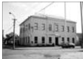
01165 LADNÁ - objekt k podnikání v centru obce - 3.180 mil. Kč

01174 BŘECLAV - pron.obch.pr.170 m 2 + 135 m 2 skl.na hl.úlicí.....35.100,- Kč 01171 BŘECLAV - pron.obch.,výr.,sklad.,pr., 380 m 2 .....800,- Kč/ m 2 01146 BŘECLAV - pron.4 podl.obj., v souč.rest.a zábavní prost. .... 80.000,- Kč 01125 KOSTICE - pron.skladových prost.212 m 2 .....7.000,- Kč/měs 01151 BŘECLAV - pron.neb.prost.na PĚŠÍ zóně.....7.500,- Kč/měs 01144 BŘECLAV - pron.neb.prost.-kancelářl..... od 400,- Kč/m 2 01141 VRBICE - lisovna s kvelb.vinným sklepem ..... 80.000,- Kč 01148 BŘECLAV - garáž v centru, ul. Sladová .....160.000,- Kč