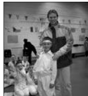
Irské děti předvedly učitelům ukázkou národních tanců a divadla.

aktivitách pokračovat. Každopádně budeme vyvíjet snahu, aby byla do takových akcí zainteresována většina vyučovaných předmětů a zapojilo se tak co nejvíce žáků i učitelů. Používání cizích jazyků by mělo být naprosto samozřejmou potřebou našich žáků. (pk)