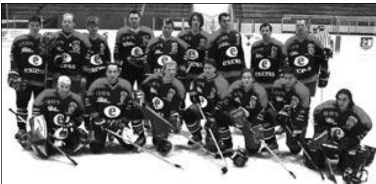
Tým Břeclavských lvů si splnil předsevzetí - postoupil mezi první šest týmů do nadstavbové části krajského přeboru a tým si zajistil účast v play off.

Město se snaží o maximální finanční podporu tohoto projektu, takže rodičům budoucích hokejových hvězd se náklady na jejich výchovu snižují na minimum.