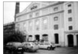
01171 BŘECLAV - pronajem 380 m 2 -obchod, výroba, sklad 800 Kč/m 2 rok

NABÍDNĚTE - Hledáme pro naše klienty rod. domky a byty v Břeclavi a okolí ROZŠÍŘENÁ NABÍDKA na http://www.slaviark.cz/