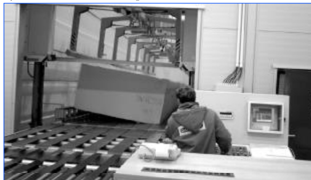
Při slavnostním otevření haly byla hostům předvedena činnost výkonného technologického jeřábu a velké řezací linky.

Výstavba nové haly je pro Gumotex největší stavební investicí v posledních patnácti letech.