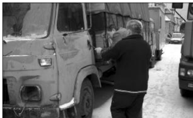
Podle zaměstnanců firmy SD Ferotech nezabere likvidace vozidla více jak jeden den.