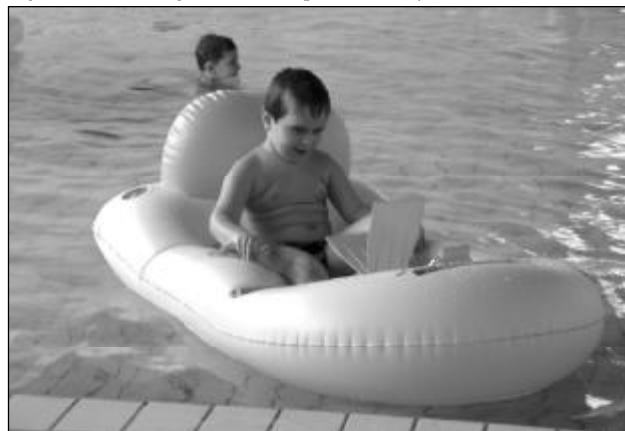
Od ledna je na krytém bazénu v provozu také novinka v podobě vodních atrakcí pro mladší děti.

„V rámci prevence civilizačních chorob, udržení fyzické zdatnosti a pravidelnosti pohybu seniorů jsme založili „SENIOR KLUB DELFÍN“. Členem klubu se může stát každý, kdo dovrší důchodového věku, chce pravidelně kondičně plavat a bude se dle možností a zájmu zúčastňovat klubem organizovaných akcí. Každý člen klubu obdrží členský průkaz, který bude mít při zakoupení permanentky na 30 vstupů bonus tří vstupů zdarma. Členský příspěvek na jeden rok činí 15 korun. Pro členy klubu, kteří projeví zájem, budou organizovány v různých časových intervalech akce, jako například zdokonalování v technice plavání, plavecké soutěže, fyziologické testy pod dohledem lékaře a podobně,“ uvedl Janík. Podrobnější informace zájemci obdrží přímo na krytém bazénu. (red)