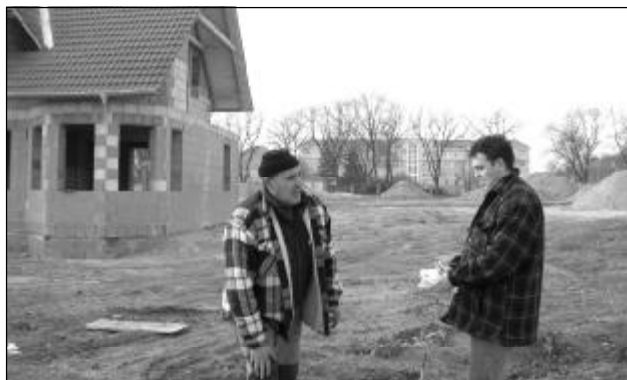
V lokalitě za kasárnami přibudou další domky na jaře.

Spousta lidí ale nedovede zkoordinovat čerpání úvěru s požadavky bank a tím se vše prodlužuje,“ uvedl stavbyvedoucí Zdeněk Sedlák.