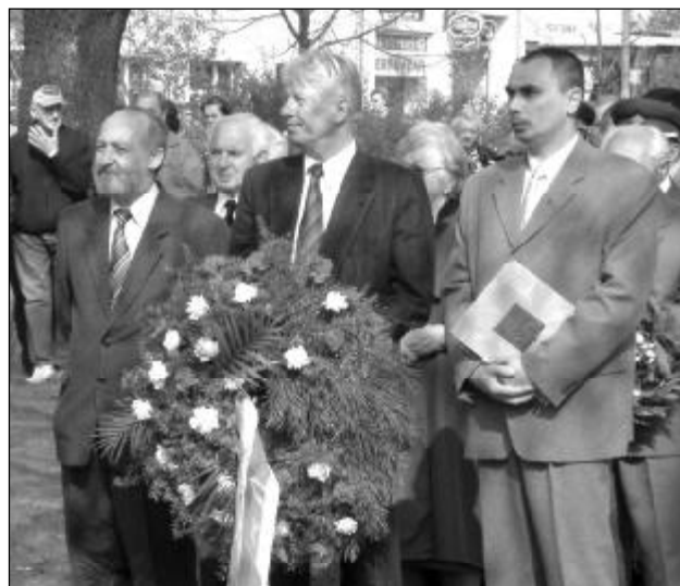
Pietní akt proběhl tradičně v městském parku u pomníku rudoarmějce.

Po 17. dubnu se fronta posunula k Poštorné a Charvátské Nové Vsi, které byly osvobozeny 21. dubna 1945.