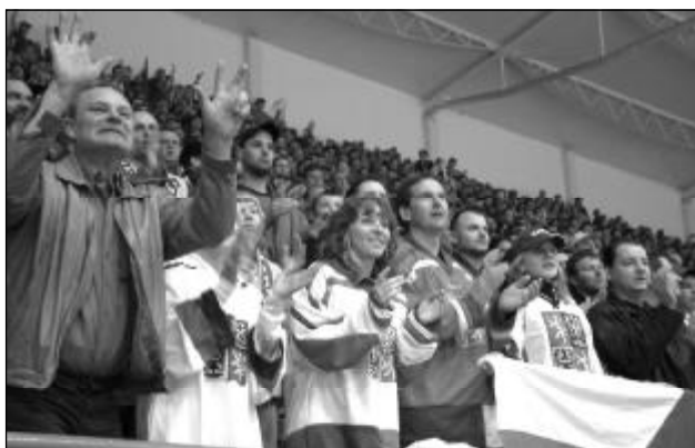
Jednohlasné výzvy diváků k přidání osmého gólu zůstaly nevyslyšeny.