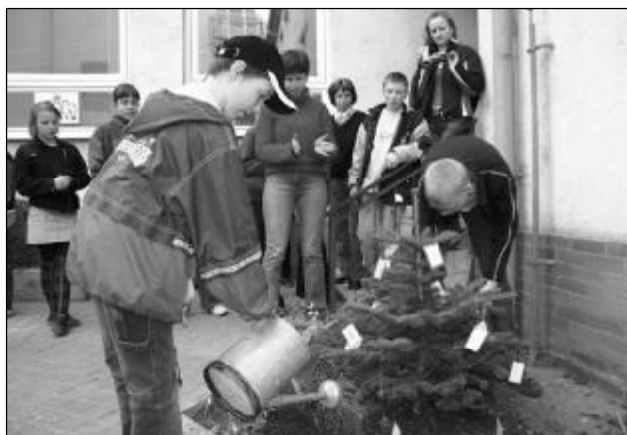
Strom Pohádkovník.