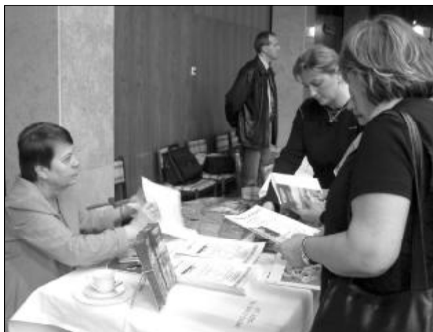
V průběhu konference představili nabídku zástupci breclavských ubytovacích a sportovních zařízení.