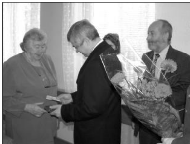
Vyznamenání ruského prezidenta Putina předával generální konzul.

Ve večerních hodinách proběhl v Domě školství slavnostní koncert, kde byly předány pamětní listy města třinácti členům Českého svazu bojovníků za svobodu.