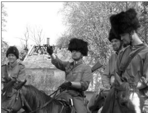
Současný stav zámku i okolních budov vzbuzoval přímo válečnou atmosféru.

Velká podívaná čekala návštěvníky areálu pod zámek v sobotu 16. dubna. Proběhla zde rekonstrukce osvobozovacích bojů za účasti zhruba šedesáti vojáků v dobových uniformách. Do boje tak vyrazili obrněný transportér německého wehrmachtu „Haki“ , historické motocykly, ruský tank T 34, sovětské jezdeckto na koních a samozřejmě vojáci vyzbrojení dobovými zbraněmi. Vynikající kulisou se stal břeclavský zámek. Boj začal, když v jednom z jeho oken průzkumníci objevili německé kulometné hnízdo.