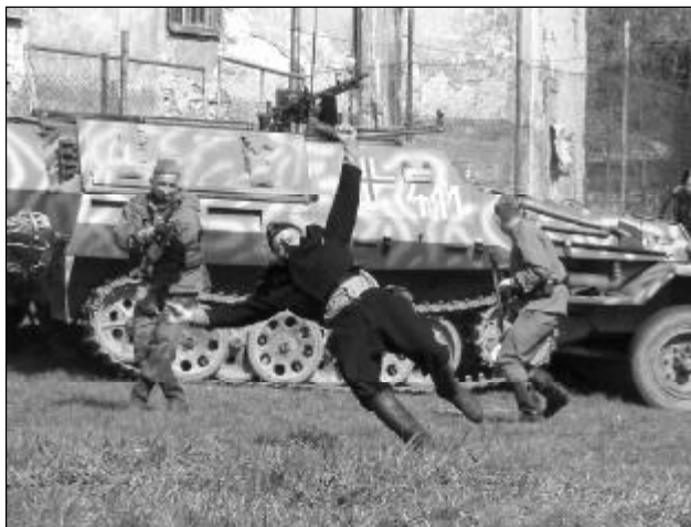
Žádný z Němců ruským vojákům pod zámek neutekl.