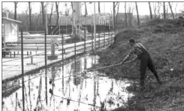
Odběr vzorků vody prováděli pracovníci akreditované společnosti Labtech.