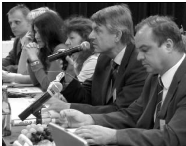
Setkání sedmi partnerských stran spolupracujících na projektu logistiky v Břeclavi se zúčastnil také poslanec Evropského parlamentu Petr Duchoň.

Již v polovině příštího roku lze očekávat první výsledky projektu „Regionální rozvoj a dopravní logistika“, které budou podkladem pro první investiční záměry do lokality určené k vybudování logistického centra.