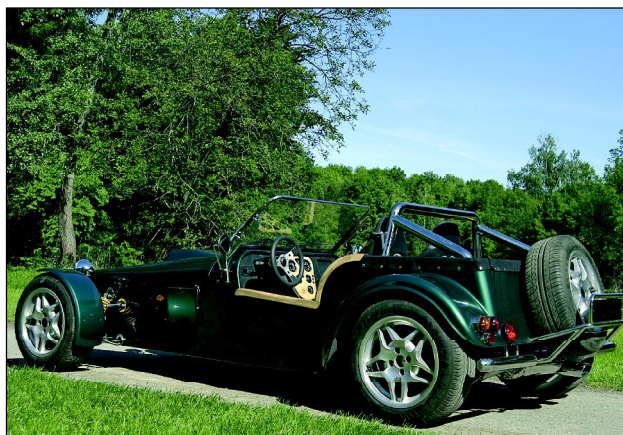
První dva typy automobilů nazvané Carlos a Stanley si odbyly evropskou premiéru 2. června na brněnském Autosalonu. Carlos (na snímku) je osazen motorem BMW o objemu 1800 cm 3 . Jeho doporučená rychlost činí 140 km v hodině a spotřebojuje 8,5 litrů paliva na 100 km.

Streamer v překladu znamená prapor. Zda Autohandl pozvedne onen pomyslný prapor skomírající české motocyklové výroby, ukáže čas. (pk)