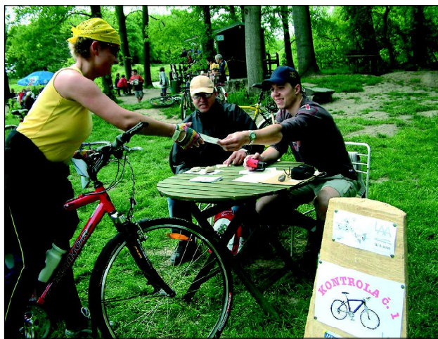
Kdo si v autokempinku zakoupil cyklopas a následně jej nechal potvrdit na dvou kontrolních stanovištích hlavního okruhu stezky, soutěžil o kolo a jiné ceny.