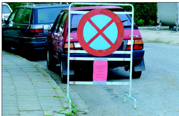
Podrobné informace naleznete pod přenosnou zákazovou značkou. Blokové čištění probíhá většinou v jednom pracovním dni.