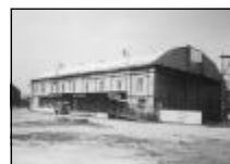
01176 Břeclav Pronájem haly s rampou 1279 m 2 pobl.šic centra 650,-Kč/m 2 /rok

NABÍDNĚTE – Hledáme pro naše klienty rod. domky a byty v Břeclavi a okolí ROZŠÍŘENÁ NABÍDKA na http://www.slaviark.cz/