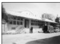
01213 Břeclav Obj. k podnikání (obchod, sklad) 275 m 2 pobl.šic centra 1 645 000,-Kč