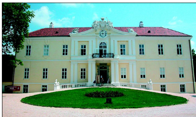
Lichtenštejnský zámek ve Wilfersdorfu, nejnižší rodové sídlo Lichtenštejnů.

Z Břeclavi vyrazíme přes Poštornou po Lichtenštejnské stezce k hraničnímu přechodu Poštorná – Reinthal. Na rakouské straně je stezka značena stejně jako u nás - Žluté cedule s erbem Lichtenštejnů a symbolem kola. Na křižovatkách je značení česko-německé. Stezka vede v mírně zvlněné krajině bez větších stoupání, z velké části po polních cestách, případně po silnicích druhé třídy s minimálním pro-