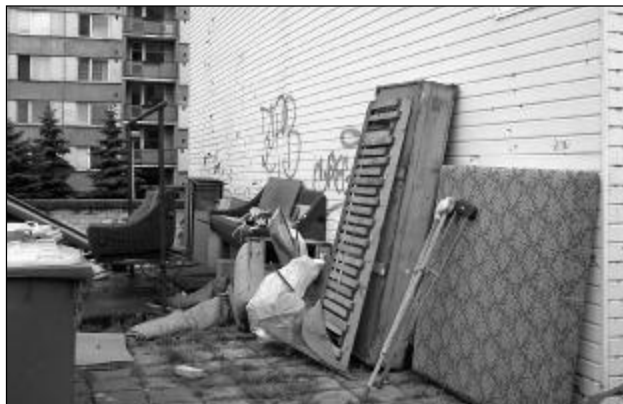
Neznámý aranžér přikrášlil v půli července okolí bytového domu na sídlišti U Splavu. Vděční spoluobčané „děkují“.