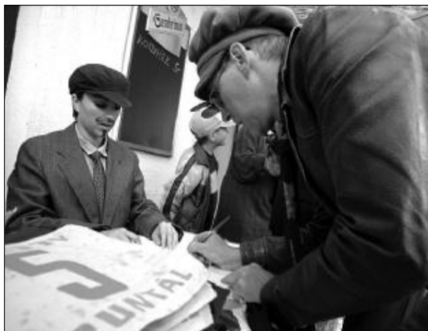
V dobovém oblečení probíhala také přísná prezentace závodníků.

„Jsme rádi, že také letos všechno klaplo, nevznikl žádný problém a lidi se doufám bavili. Vždyť prvořadým zájmem bylo pobavení lidí a ne kdo protne cílovou pásku.“ Následné veselí pokračovalo zábavou na dvoře za poštou do časných ranních hodin. (pk)