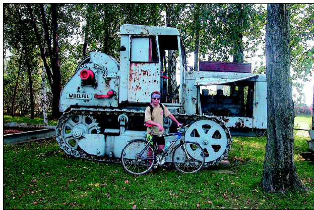
Neusiedl an der Zaya – venkovní muzeum historických strojů.

Muzeum nesmyslů Z Wilfersdorfu se musíte vrátit kousek po stejné trase zpět a pak odbočit doleva na Ebersdorf a Walterskirchen, kde stojí malý zámek Coburg. Pak už je to kousek do Poysdorfu, kde najdete například "Old-timemuseum", a hlavně jde o proslulé vinařské městečko se spoustou historických sklípků, vinařským muzeem a řadou zajímavých společenských akcí v průběhu celé sezony. Na adrese Liechtensteinstrasse č. 1 má své sídlo příhraniční region Weinviertler Dreiländereck. Z Poysdorfu kopíruje Lichtenštejnská stezka další cyklostezku poetického názvu „Veltlínská“. Obec Herrnbaumgarten je vyhlášena především svým „Muzeem nesmyslů“ (tzv. Nonseum). Sami místní jej popisují jako „muzeum věcí, které nikdy nebudete potřebovat...“ No a ve Schrattebergu si můžete vybrat ze dvou cest - buď nahoru na hraniční přechod do Valtic a pak po některé z cyklostezek do