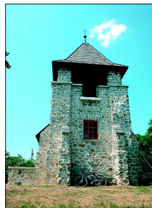
Vyhlídková věž v rakouské vinařské obci Altlichtenwarth na Lichtenštejnské stezce.

Í když jsou Lichtenštejnské stezky dobře značené, doporučuji sehnat si před jejich absolvováním mapu. Česká verze je k dostání v TIC na břeclovské radnici, popřípadě si vyžádejte dvojjazyčnou cyklomapu Liechtensteinroute, která je zdarma k dostání v sídle regionu v Poysdorfu a je možné si o ni napsat na adresu: Weinviertler Dreiländereck, Liechtensteinstrasse 1, A-2170 Poysdorf, Rakousko.