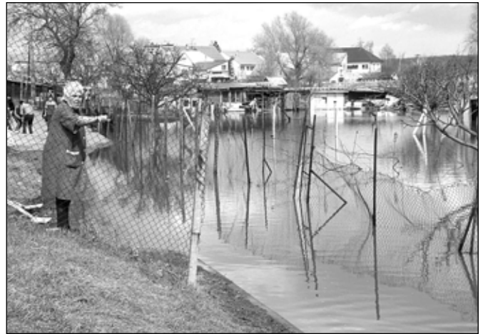
Charvátská Nová Ves, lokalita U Jezera.

Na Břeclavsku bylo nasazeno pětadvacet policistů, šedesát policistů Střední policejní školy MV Brno, dvacet vojáků a deset vozidel. V pohotovosti byly síly a prostředky pro evakuaci většího počtu osob a střežení evakuované oblasti.