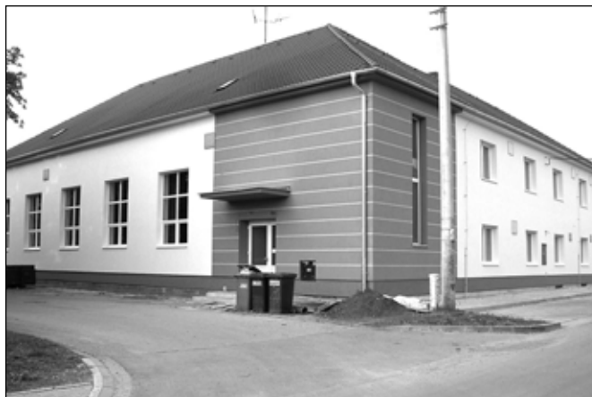
Koncem dubna probíhaly poslední terénní úpravy v okolí sokolovny.

ní otevření bude doprovázeno kulturním programem, který zahájí v 19.30 hodin. Vystoupí v něm dechová hudba Charvatčanka, která zároveň slaví 40. výročí svého založení. Chybět nebude slovácký krúžek Charvatčané, který vystoupí za doprovodu cimbálové muziky Husaři. Zvána je široká veřejnost. (pk)