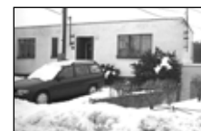
Bř.-Poštorná RD 4+1, garáž, zahrada, 1 605 m 2 2 575 tis. Kč

Pro své klienty HLEDÁME: * RD a byty v OV Břeclav a okolí, nabídněte nemovitost a získáte podíl z provize RK 30 %