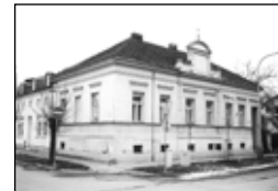
01292 Břeclav RD 4+1 poblíž centra, vhodný i k podnikání, možná dohoda

NABÍDNĚTE - Hledáme pro naše klienty rod. domky a byty v Břeclavi a okolí ROZŠÍŘENÁ NABÍDKA NA http://www.slaviark.cz