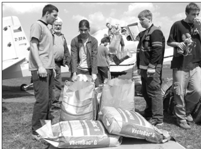
Poděkování si jistě zaslouží zhruba třicet učňů z břevlavského učiliště na Sovadinově ulici, kteří na letišti neúnavně plnili zásobníky letadel.