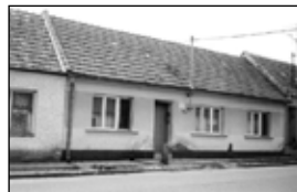
01284 Hlohovec RD 3+1, pozemek 245 m 2 850 000 Kč

BŘECLAV - pron.kancelář v centru (býv. MěÚ), příp. pobl. centra ROZŠÍŘENÁ NABÍDKA NA http://www.slaviark.cz