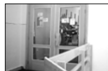
Bř. hl. třída obch. prost., 1.p. 158 m 2 PRONÁJEM 25 tis. Kč/měs