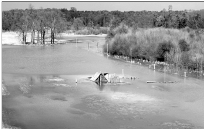
Letošní povodeň na Pohansku.

Přesto se v ulicích města podařilo Dyji udržet v korytě. Jenom v Břeclavi boj s velkou vodou spolkl okamžité finanční náklady přesahující statisíce korun. Koncem dubna dosáhly povodňové škody ve správním obvodu města Břeclavi 33 milionů. Tato suma ještě nezahrnuje škody organizací a společností s nadregionální působností (např. Lesy ČR, Povodí Moravy a pod.), které vyhovují součty škod samostatně.