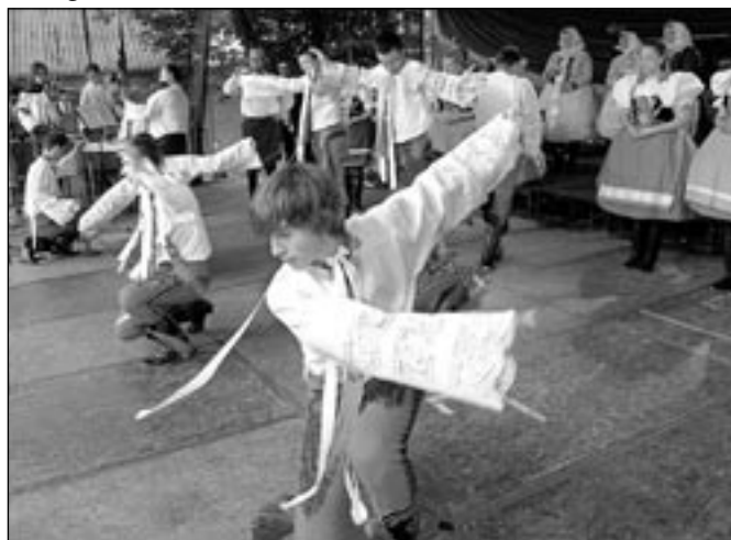
Slovácký krúžek Poštorná vystoupil v hodinovém pořadu písní a tanců z Poštorné.