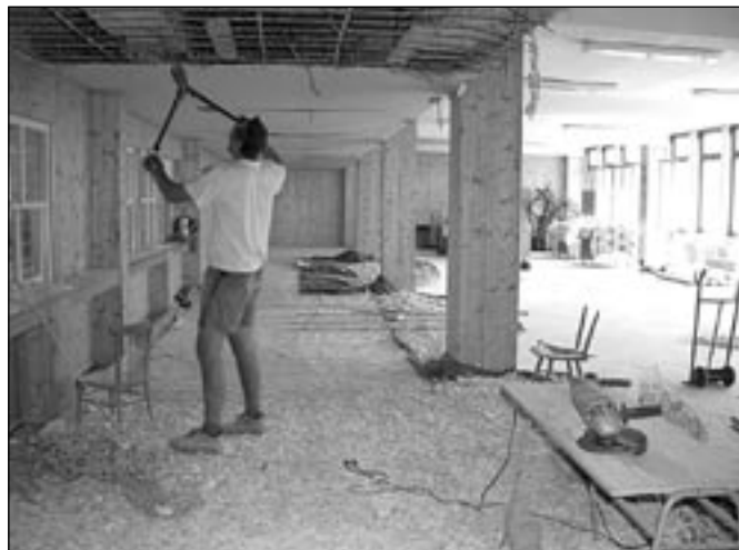
Po prázdninách bude na žáky ZŠ Slováká čekat nová kuchyně i jídelna. Jednou z novinek bude výběr ze tří jídel.

Třicetí milionů korun dosáhnou celkové investice na ZŠ Na Valtické po třech etapách probíhajících od roku 2004. V předchozích letech byla provedena výměna prosklených ploch vstupní části a tělocvičny. „Výměnou 250 oken a zateplením objektu došlo ke značné úspoře energií,“