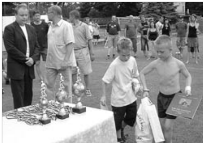
Ceny od zástupců fotbalového svazu, sponzorů turnaje a města Břeclavi převzali také hráči breclavské přípravy, kteří si na tak velkém turnaji odbyli premiéru.

Z mistrovského turnaje vyšla vítězně Sparta Praha po tom, co ve finále porazila Olomouc. S nejlepšími celky republiky poprvé změřili své síly také hráči MSK Břeclav, kterým se podařila uhrát jediná remíza s Hradcem Králové. (pk)