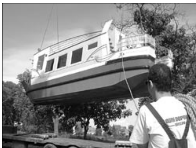
Z nákladního auta na vodu loď přenesl obří jeřáb.