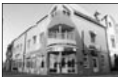
01339 BŘECLAV pron. obch. Prost. 3 m 2

01325 TVRDONICE - RD 4+1, ihned k bydlení ..... 1,060 mil. Kč 01330 VELKÉ BÍLOVICE - RD 1+1, průjezd ..... 460.000 Kč