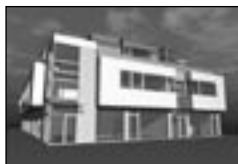
Bř. kanceláře 25 - 30m 2 , 1.p. parkov. PRONÁJEM 1.500 Kč/m 2 /r