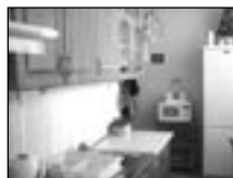
Bř. Valtická dr. byt 3+1, pěkný, 3.p. nová kuch. linka ..... 810 tis. Kč