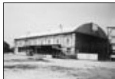
01176 BŘECLAV pronájem haly s rampou