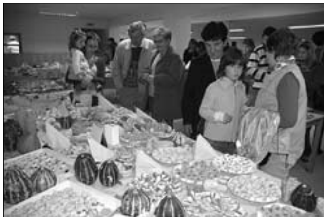
Zajímavý program pro rodiče a veřejnost proběhl v místní Sokolovně. Po kulturním vystoupení žáků a cimbálové muziky se prezentovala každá z devíti tříd vlastním rautem.

Růžička. Škola byla také na čas zrušena a to v roce 1946, kdy se stala součástí školy v Poštorné. Díky úsilí místních byla výuka obnovena od roku 1950. Od roku 2004 je škola sloučena s Mateřskou školou Tyršův sad. Celé zařízení navštěvuje téměř 230 dětí. Není bez zajímavosti, že při škole pracuje včelařský kroužek, každoročně je pořádán družinový tábor a dodnes zůstal zachován školní zvon. Každoročně si na něj „naposled“ zazvoní vycházejí-