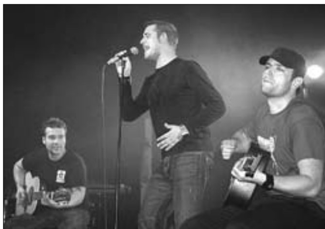
Kapela Clou předvedla, že umí i akusticky.