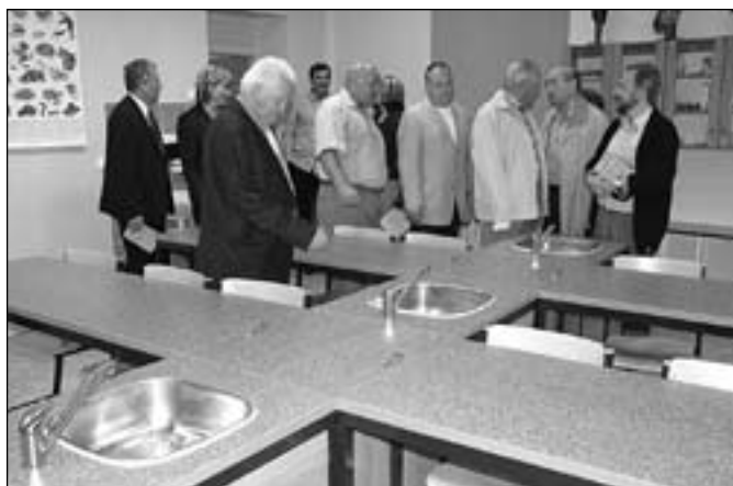
V rámci oslav si hosté se zájmem prohlédli také nové učebny.