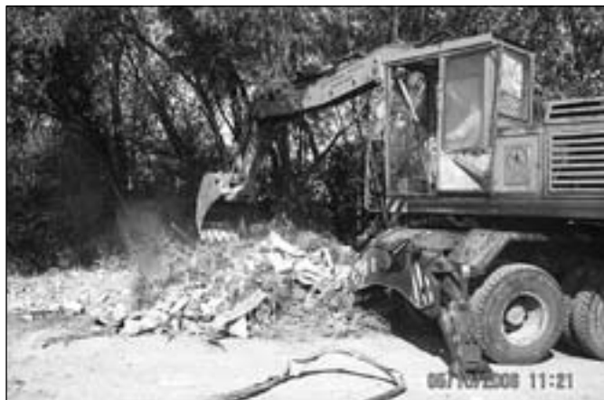
Na likvidaci černých skládek byla nasazena také těžká technika.

Problémové lokality na území města Břeclavi budou monitorovány městskou policií a příštího jediní, kteří se odpadu zbavují nelegálním způsobem, budou pokutováni. (Han)