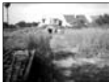
Podivín st. poz. na sam. RD s vinným skl. 3.018 m 2 .....1,040 tis. Kč