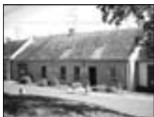
Sedlec příz. RD 3+1, vjezd, po rekonstr., zahr. 1.493m 2 ..1,560 tis. Kč