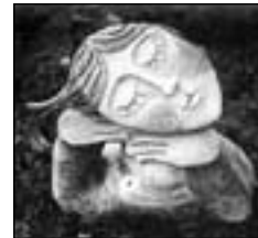
Repro keramika I. Bambasové „Zasněná“

Galerie nabízí: Oceňování obrazů a jiných výtvarných děl, jejich restaurování a veškeré služby zájemcům o výtvarné umění. Otevřeno: úterý až pátek od 14.00 do 17.00 hodin. Tel.: 519 372 118, 723 930 015, více informací na www.vojtek-av.com