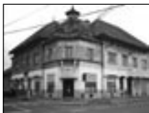
Bř.-Pošt., tř. 1. máje, komerč. objekt s byty, poz. 437 m 2 ... os. jed.