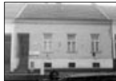
01371 BŘECLAV - RD 3+1 pob. centra, 1,275 mil.Kč

01365 BŘECLAV - dr.byť 3+1, centrum, úpravy . . . . . 1,015 mil. Kč 01293 LNŽHOT - prostorný RD 7+1, p.566 m 2 . . . . . 1,695 mil. Kč