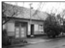
Ladná RD 3+1, vjezd, hosp. část, zahrada 956 m 2 ... 1,040 tis. Kč