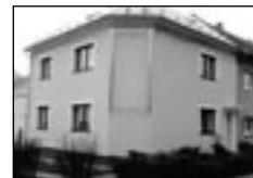
01367 BV-POŠTORNÁ - pron. nadstand neb. prostor