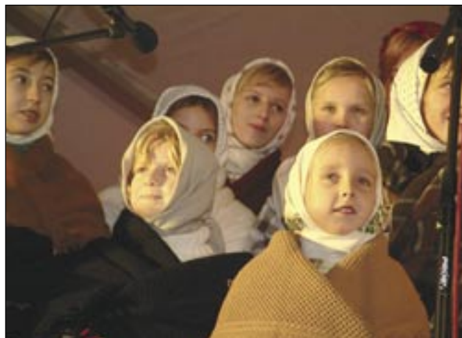
Pásmo tradičních dětských radovánek doplněných stavbou sněhuláka na pódiu předvedli stylově odění Koňárci z Poštorné.

(Fotoreportáž z předvánoční Brno najdete na straně č. 9.) (pk)