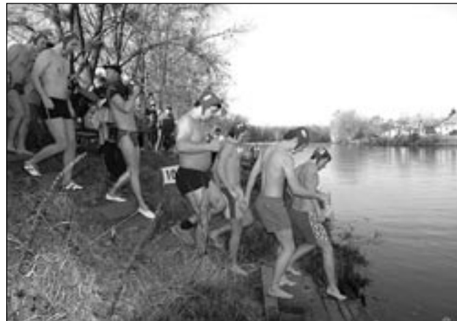
Plavci procházející se v mrazivém počasí po hrázi pouze v plavkách každoročně vzbuzují u přihlížejících obdiv.