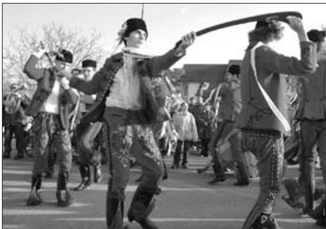
Tanec Pod šable v podání Poštoranů.