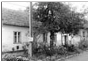
01384 - RD VALTICE 1.001 m 2 , 690.000,-Kč

01371 BŘECLAV - RD 3+1, nám. Svobody . . . . . 1,275 mil.Kč 01342 BŘECLAV - pronájem zatepl.haly 145 m 2 . . 13.300,- Kč