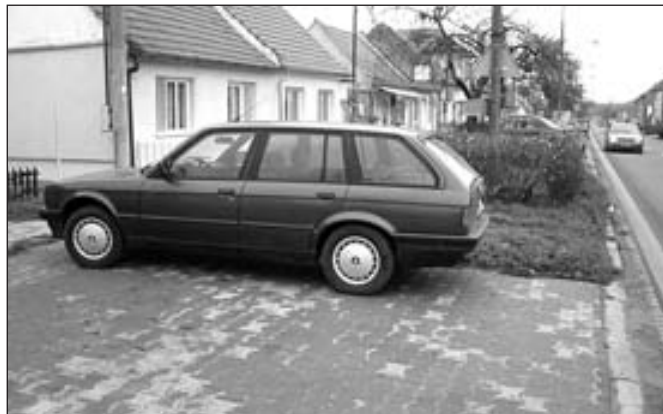
Pokud to povaha místa dovoluje, lze na něm zřídit parkovací místo.