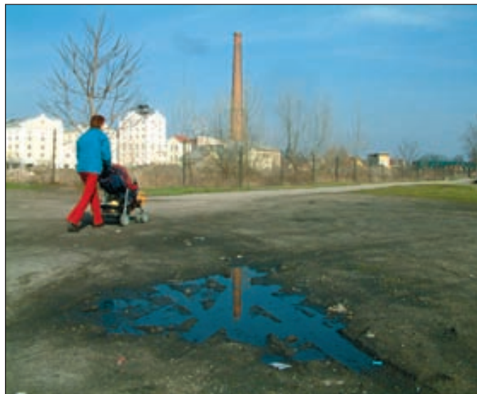
Část plochy areálu bývalého cukrovaru dnes. Návrhy její nové podoby najdete na straně č. 4.

dov a následnou výstavbou s termínem dokončení v roce 2010. (pk)