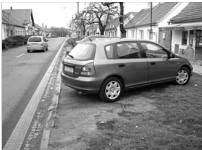
Parkování na veřejném prostranství bude od dubna řešeno jako přestupek.