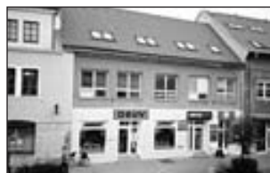
01373 - BŘECLAV kanceláře na hl. třídě