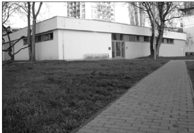
Nový objekt zahrnuje víceúčelový sál pro zhruba sto osob, menší jednací sál a kanceláře. Bezbariérový přístup je samozřejmostí.

V první řadě se ale musíme chovat jako dobří hospodáři. Kulturu je třeba dělat tak, aby byl zajištěn její dlouhodobý rozvoj, jaký si město do budoucna může dovolit. Záměrem proto je, aby peníze získané prodejem budovy současného muzea posloužily k pořízení nové expozice a vybavení nové nadstandardní budovy. V ní by své místo měla mít také stálá expozice Lednicko-valtického areálu, který si ná-