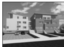
St. Bř. nadstand. byty 2+1, mezonet 5+1 a 6+1 nová výst. .... os. jed.