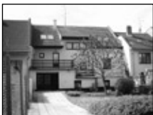
Bř. nadst. sídlo firmy 6 kancel., klimat., alarm, parkov. PRONÁJEM