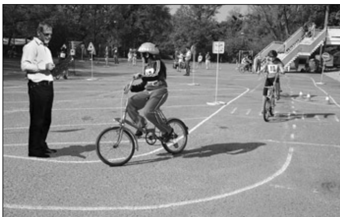
Parkoviště zimního stadionu se na jeden den proměnilo v dopravní hřiště se značkami a semaforem, ale také v překážkovou dráhu.