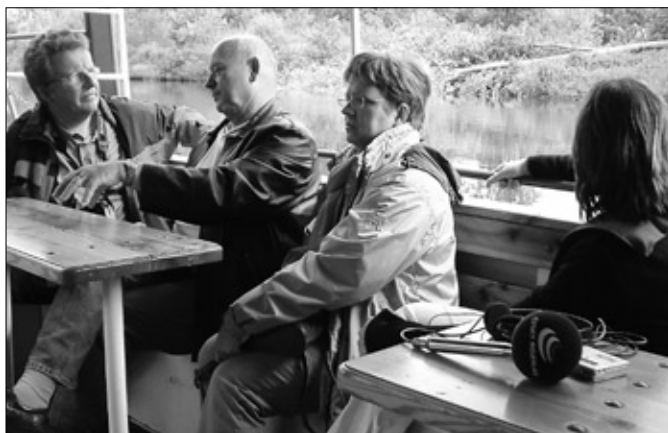
Zejména novináři se přesvědčili, že Lednicko-valtický areál lze objevovat také z paluby lodi či ze sedla koňského povozu.

maděpravděpodobněnespatříme nikde v Evropě. „Je smutné, že je ve srovnání s Lednicí opomíjena zámecká zahrada ve Valticích, protože i zde se nachází spousta vzácných dřevin. Také sochy se zajímavými antickými příběhy by si zasloužily více pozornosti a zejména péče,“ říká Dymo Piškula, pro kterého je nejmystičtějším místem Kaple svatého Huberta. „V podloubí kaple jsou vyryta jména téměř všech stavitelů působících ve službách Lich-