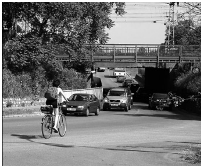
Nový podchod má být vybudován pod kolejištěm nalevo od současného podjezdu.