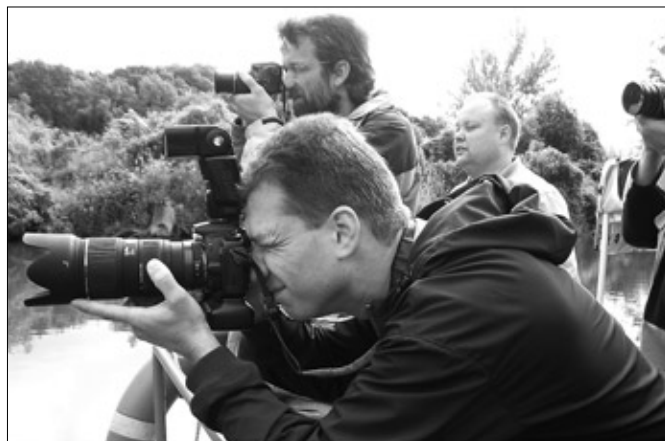
Příroda, a zejména vodní ptáci, nenechali v klidu jediného fotografa.

Podoba parků anglického a francouzského, které jsou součástí zámeckého parku v Lednici, je bezpochyby mistrovským dílem tehdejších zahradníků. Z různých zemí se svážely sazenice stromů, které takto pohro-