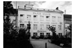
01261 BŘECLAV - pron. 4 podl. obj. v centru