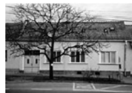
01389 POŠTORNÁ RD 3+1, 1,560 mil. Kč

01402 ST.BŘECLAV - garáž po rek., U Ján.dvora ... 149.000,- Kč 01401 BŘECLAV - pron. zařiz. bytu 3+1 s garáží ... 8.000,- Kč + ink.