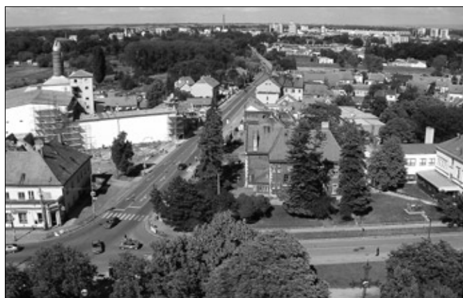
Úchvatný pohled z věže poštorenského kostela, která zatím není veřejnosti přístupná.