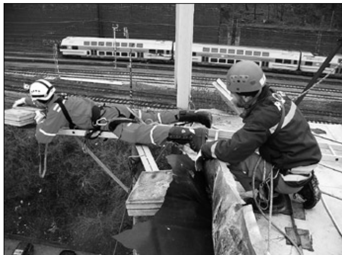
Během výcviku ve středních Čechách byli starobřeclavští hasiči povoláni k odstranění anténního systému GSM ze střechy výškové budovy. Celý zásah se odehrál ve výšce srovnatelné s devítipatrovou budovou a trval pět hodin.