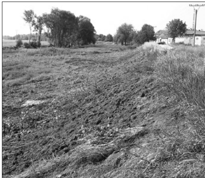
Černá skládka na poštorenské hrázi byla zlikvidována v závěru května.