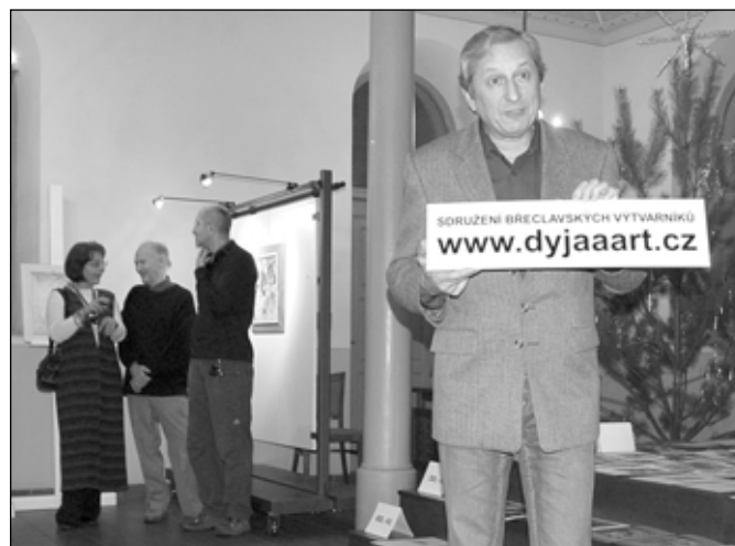
Na vernisáži umělci pokřtili své nové webové stránky www.dyjaaart.cz