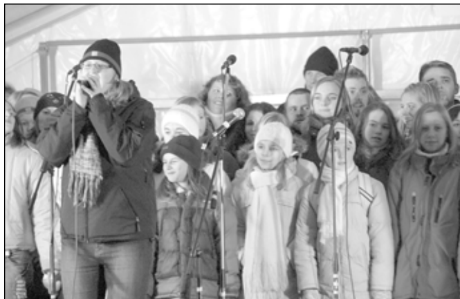
Návštěvníci slavností mohli slyšet různé hudební žánry. Mezi hojně sledovaná vystoupení patřil i gospel.