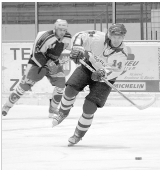
Velkou Bíteš breclavští hokejisté porazit nedokázali.

aby skákající kotouč usměrnil do prázdné klece. Výhodu jednoho hráče na ledě využil až Balát v závěru třetiny a poslal domácí do vedení. Hned ve čtvrté minutě poslední dvacetiminutovky zvýšil na 3:1 Šimeček, když potrestal chybu hostujícího gólmana. Vzápětí ale Bíteš vstřelila kontaktní gól a Břeclav začala kupit jednu chybu na druhou, což hosté potrestali znovu ve 14. minutě, vyrovnali na 3:3 a dvoubrankový náskok se tak ve chvíli vytratil. Velký obrat byl dokonán tři minuty před závěrečnou sirénou a hosté si už vedení 4:3 pohládali. K vyrovnání nevedla ani závěrečná power-play a v čase 19:33 upravila Velká Bíteš skóre trefou do prázdné branky. I za vydatné podpory domácího publika tak Břeclav soupeři podlehl 5:3. (dan, red)