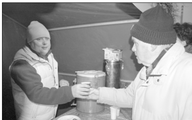
Starostův svařák patřil k nejoblíbenějším nápojům.