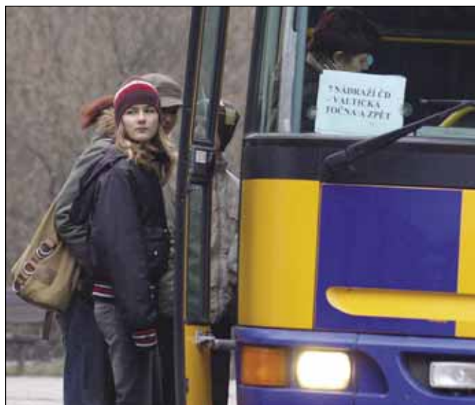
Cena předplaceného jízdného pro žáky a studenty se nemění.

Motivovat lidi k používání karet chce město zejména proto, aby odbavení pasažérů v autobusech bylo co nejkratší a tím se omezily také prostoje autobusů na zastávkách. „Pokud bude karty využívat většina pasažérů, můžeme také dobře sledovat přepravní proudy obyvatel,“ řekl Snovický. (Pokračování na str. 2)