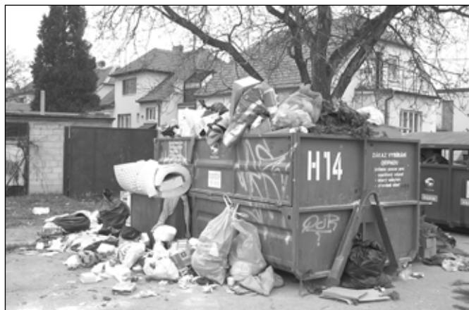
Zvlášt po vánocích není problém najít v přeplněných kontejnerech nepovolený odpad.

jemové kontejnery jsou určeny pouze pro fyzické osoby, které platí místní poplatek za odpady.