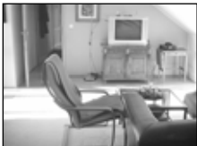
* Bř. centr. půdní byt 143 m 2 , terasa, plov. podlahy, kuch. linka . . . 1,948 tis. Kč