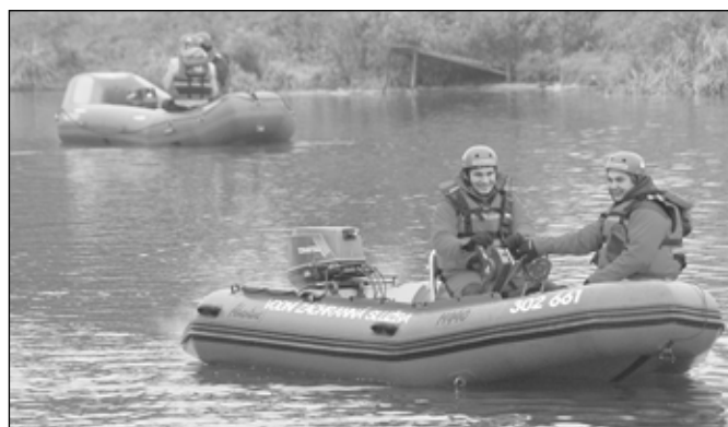
Mrazivé počasí otužilcům nevadilo. Někteří bez neoprenu uplavali i jeden kilometr. Bezpečnost zajišťovaly pendlující záchranářské čluny.