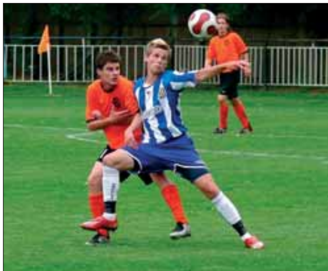
Se Zlínem Břeclavští remizovali 3:3

ČMFS ročníku 2008/2009. Muži břeclavského Ačka však na svého soupeře musí čekat, protože v předkole Poháru se 20. červen-