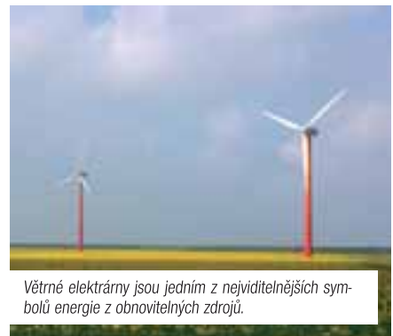
Větrné elektrárny jsou jedním z nejdůležitějších symbolů energie z obnovitelných zdrojů.

Ne každému se musí líbit, protože jsou skutečně nepřehlédnutelnou dominantou na obzoru. Na druhé straně jsou ale i lidé, kteří považují větrné elektrárny v přírodě za projev toho, co nám přináší moderní technická doba. Filosofie