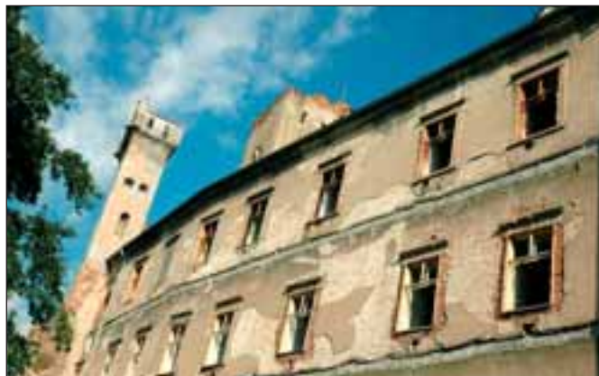
Po letošní závěrečné sanaci statiky zámku se zahájí jeho celková rekonstrukce.

Pro bytová družstva a sdružení vlastníků zajišťuje například vedení účetnictví, rozúčtování tepla na koncové odběratele, vedení technické evidence domů, zajištění předepsaných kontrol společných nebytových prostor, zajištění havarijní služby v oblastech vodo, topo a plyn,