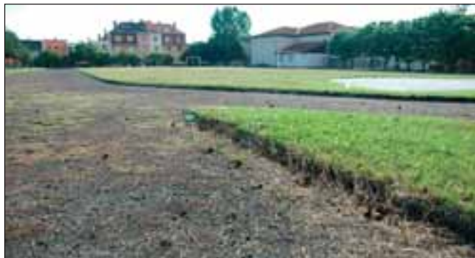
Také hřiště ZŠ Slovácká projde v budoucnu rozsáhlou rekonstrukcí.

První etapa bude ukončena v příštím roce, ale tím práce na opravách největší breclavské školy zdaleka nekončí. Evropské peníze se budou žádat také na další dvě etapy. Během nich dojde k rekonstrukci interiéru budovy, ale i školního hřiště, které by se v budoucnu mělo proměnit ve víceúčelový areál. (pk)