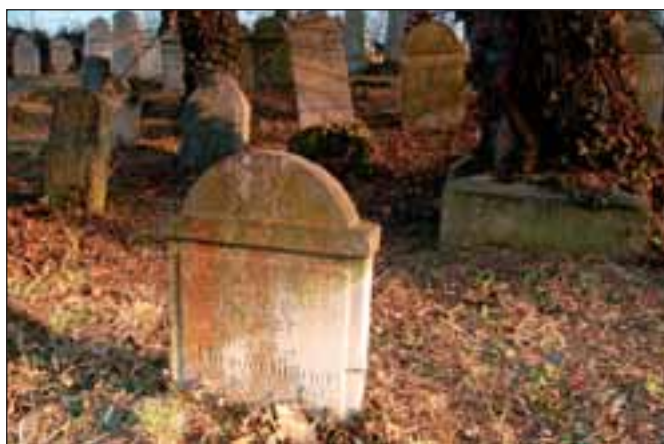
Pro rok 2008 se uvažuje i o opravě kaple a úpravě prostranství židovského hřbitova.