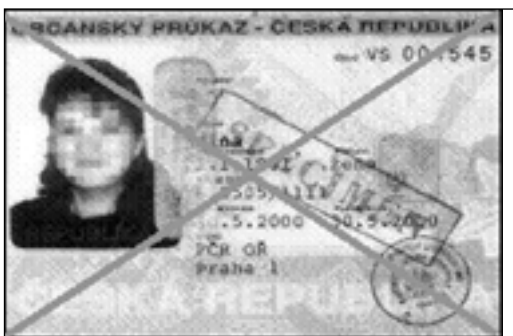
Typ OP který od 1. 1. 2009 nebude platit

• Dnem 1.1.2009 jsou tyto OP, pokud nebude provedena jejich výměna, již neplatné.