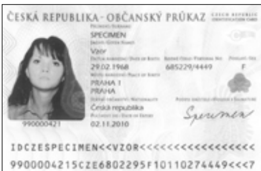
Od 1. 1. 2009 bude platit jen tento typ OP (vyjma povolené výjimky)