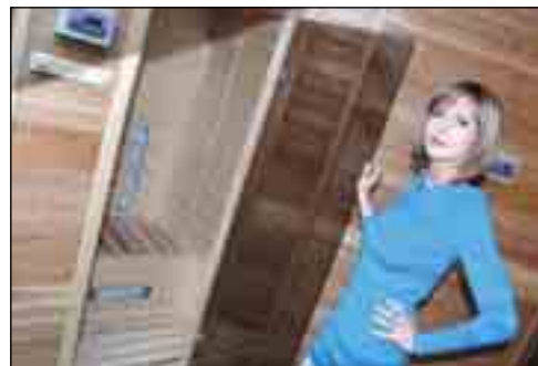
Součástí centra je i několik druhů saun.

bolesti. Aby však výsledný efekt byl trvalý je vhodné doplnit masáže i přiměřeným cvičením. „Naším hlavním cílem bylo vytvořit útulné prostředí k příjemnému