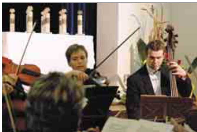
Důstojnou atmosféru večera dokresloval Břeclavský komorní orchestr.

bývalé Československo tvoří již dva státy, které se rozhodly jít vlastní cestou. Bohužel náš stát už není tvořen ani zeměmi, které dodávaly Československu životadárnou pestrost. A tak jsme u nás na Moravě museli vzít na vědomí, že naše tisíciletá historie se zastavila 1. 1. 1949, což na Nový