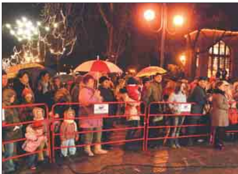
Originální výzdobou přispěli k atmosféře vánočního městečka i studenti břevlavského gymnázia. Čtyři obří plátňaní andělé zahalila řvoucí hlavu na pěší zóně. I přes nepřízeň počasí proudivly centrem dění davy návštěvníků.