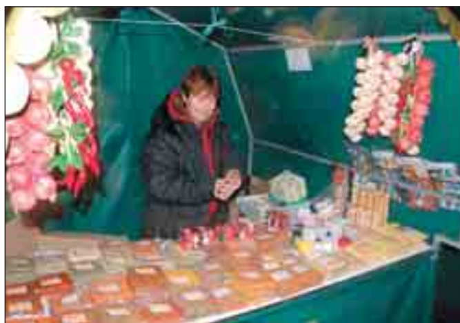
Trhovci nabízeli teplé jídlo i pití. Chybět nemohly ani drobné dárkové předměty. Už tradičně rozdával starosta svarák. Kdo chtěl, mohl přispět na hendikepované spoluobčany.