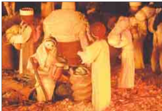
Kapli svatého Rocha zdobil Betlém z kukuřičného šustí.