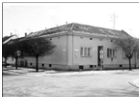
01493 BŘECLAV RD 5+2 pobl. centra 2,330 mil. Kč

01487 HLOHOVEC - RD 3+1, poz. 505 m 2 . . . . . 2,545 mil. Kč 01432 BŘECLAV - pron. nových obch. prost. 200 m 2 . . . . . inf. v RK