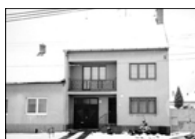
01496 RAKVICE RD 5+1, výborný stav 2,300 mil. Kč