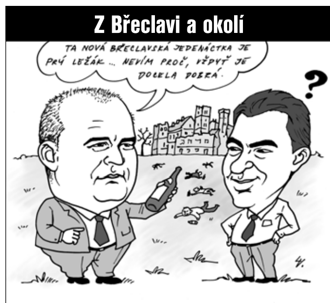
Kresba Lubomír Vaněk

Městský zpravodaj Radnice je k nahlédnutí i na internetových stránkách www.breclav.org . Kromě aktuálního čísla na webu naleznete i výtisky z let minulých.