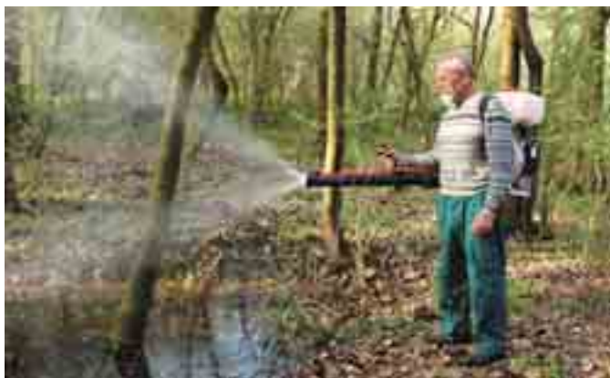
Postřiky proti larvám komárů v Kančí oboře pomohly, nezničily však všechny komáry.

Kvůli výraznému oteplení před několika týdny z lužních lesů současně vylétěla početná komáří populace. Podle odborníka na komáry Oldřicha Šebesty ale přesto stav nedosáhne kalamity.