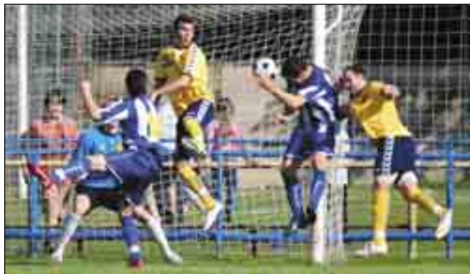
Na snímku je zachycen jeden ze čtyř gólů proti Jihlavě, kterými hráči MSK potěšili domácí diváky.

Jarní část MSFL nezačala pro breclavské fotbalisty slavně, když dostali výprask 4:0 od Uničova. V dalších zápasech se ale herně vzchopili a po remíze 0:0 se Zlínem zvítězili nad Zábřehem (3:2). Ve 20. kole sice fotbalisté MSK zaváhali proti Mutěnicím a ostudně prohráli 4:1, v dalším zápase ale porazili Bystrc (3:2) a s přehledem si poradili s Jihlavou (4:0). 23. kolo bylo pro Břeclavany symbolem remízy s Hlučínem (1:1) a aktuálně jsou na slušném 9. místě v tabulce.