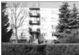
01511 BŘECLAV byt 3+1 po rekonstrukci 1,685 mil. Kč