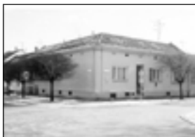
01493 BŘECLAV RD 5+2 pobl. centra 2,330 mil. Kč

01452 HLOHOVEC - RD 5+1 a 1+1 užív. i jako penzion ..... 2,330 mil. Kč 01498 BŘECLAV - dr. byt 2+1 Na Valtické, nová plast. okna ..... 750.000,- Kč