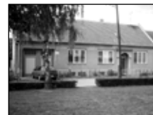
* Lanžhot RD 4+1, vjezd s garáží, dvůr, zahrada, nutná modernizace ..... os.jednání