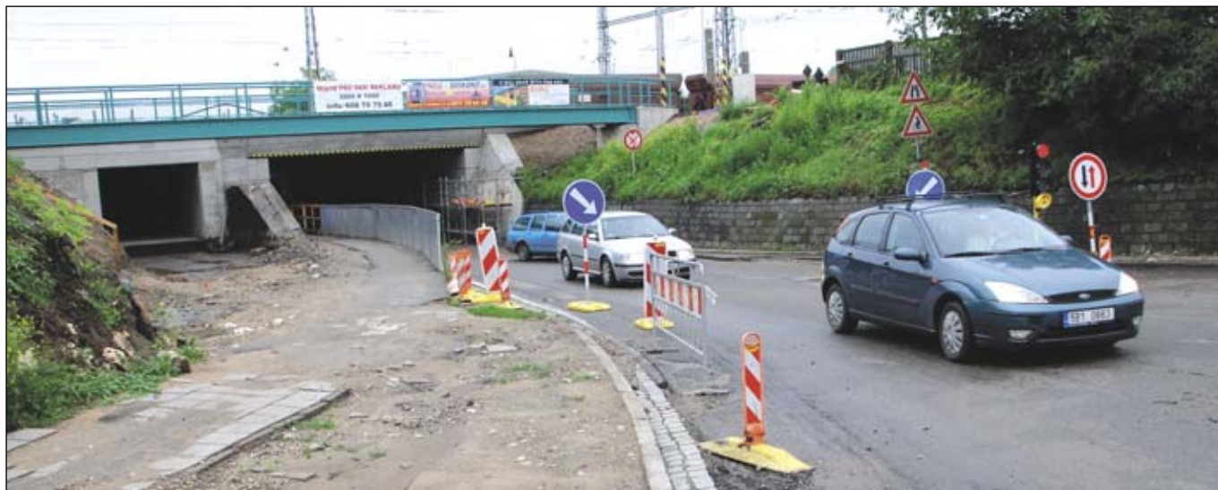
Provoz je z důvodu rekonstrukce omezen u podjezdu ve směru na Lanžhot na ulici Bratislavská, kde jej řídí semafor.