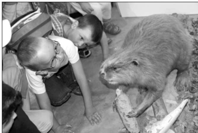
Jedním z největších lákadel výstavy je exponát bobra.

expoze, která prezentuje stromy z luk, polí a lesů jako panelové domy s velkým množstvím různorodých obyvatel. Žijí zde brouci, které si návštěvníci mohou prohlížet pod lupou nebo mikroskopem, dále ptáci i celá