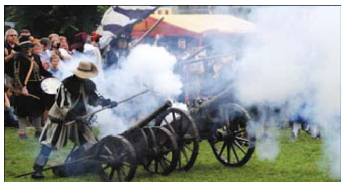
Bitvy v podzámčí vypadaly opravdu realně.