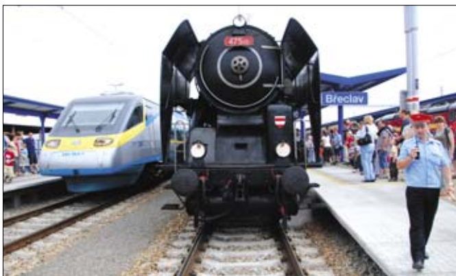
Návštěvníci breclavského nádraží mohli vidět opravdovou raritu, když si vedle sebe stoupla historická Šlechtična a moderní Pendolino.

Moravský den v nočních hodinách zakončilo ohňové představení a ohňostroj. (dav)