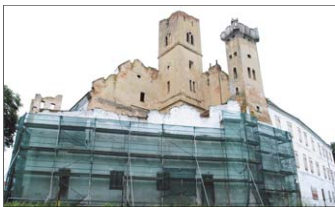
Jednou z plánovaných investičních akcí je také první etapa rekonstrukce břeclavského zámku.

V minulém roce šlo do plánovaných investičních akcí na 100 milionů korun. Ve stejném trendu hodlá město Břeclav pokračovat i letos, kdy proinvestuje až 150 milionů korun. Přes 40 milionů z toho přitom pochází z dotačních fondů, zbytek jde z rozpočtu města.