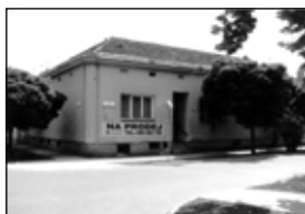
01493 BŘECLAV RD 5+2 pobl. centra 2,330 mil. Kč

01498 BŘECLAV - dr. byt 2+1 Na Valtické, nová plast. okna ..... 695.000 Kč 01526 BŘECLAV - pronájem bytu 1+1 v centru ..... 6.000 vč. ink.