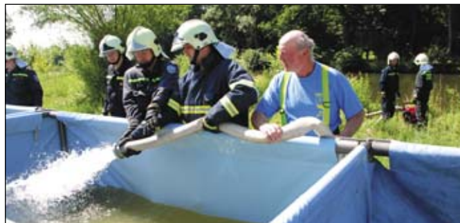
Součástí nácviku byla i stavba protipovodňových stěn, záchrana tonoucího a vyšetřování bezdomovce z nebezpečného úkrytu