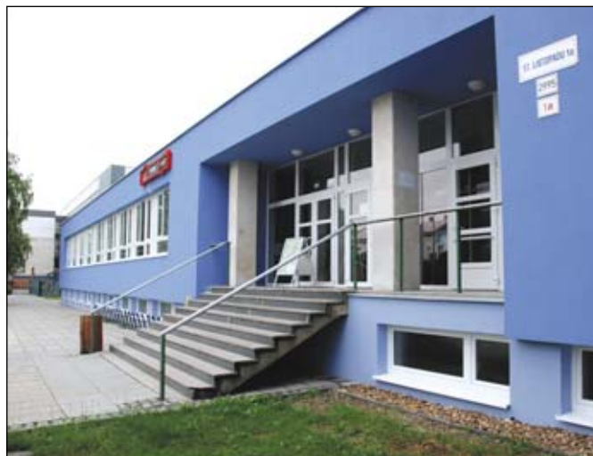
Dům školství dostal nejen nová okna. Při rekonstrukci bylo provedeno také kompletní zateplení budovy.