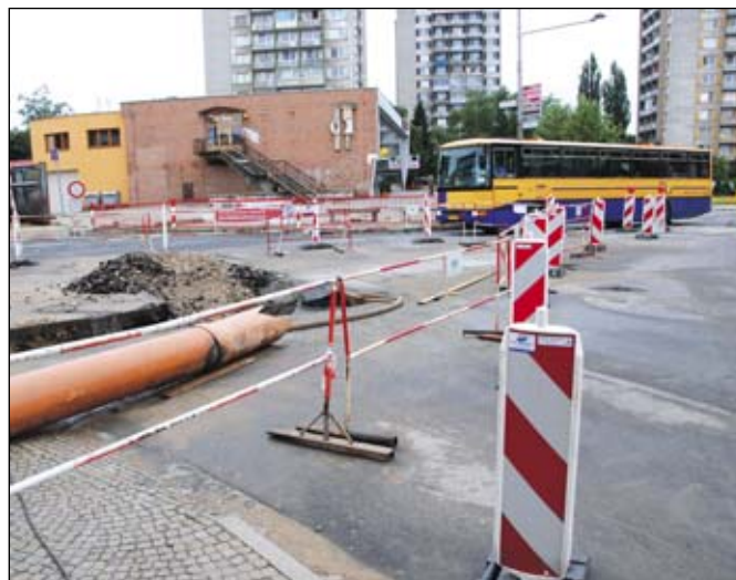
Oprava křižovatky před breclavským Gymnaziem částečně omezila provoz na jedné z největších breclavských tepen.