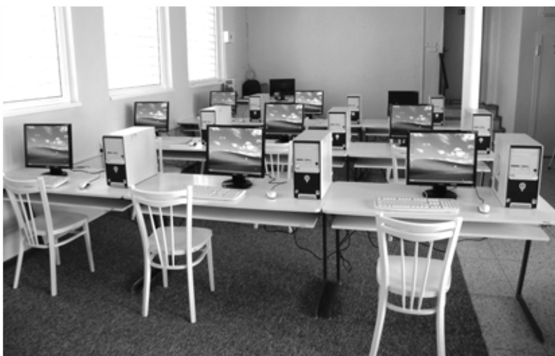
Nová internetová studovna v breclavské knihovně

Ve studovně se nachází i půjčovna zvukových knih. Zvukové