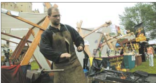
Návštěvníci slavností mohli zahlédnout i kováře.