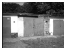
* Bř. garáž „za poliklinikou“, 23 m 2 , nutno dodělat podlahu, omítky ..... 65.000 Kč

Sady 28. října č. 23, Břeclav, tel. 519 32 13 94, tel./fax 519 32 13 95 608 711 350, e-mail: realteam@realteam.cz , http://www.realteam.cz