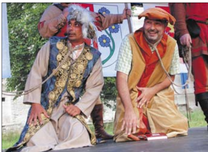
Představitelům města hrozil pod zámek Jošt Moravský oprátkou.

Letošní Moravský den se nesl v duchu třicetileté války. Davy příchozích neodradil ani lehký déšť. Naopak svěží přehánky alespoň trochu zchladily tisíce účastníků akce v jinak dusném dni. Navíc dokonale dotvářely atmosféru bojů mušketýrů, kdy vzduchem létaly „kulky“, vznášel se kouř a pach střelného prachu.