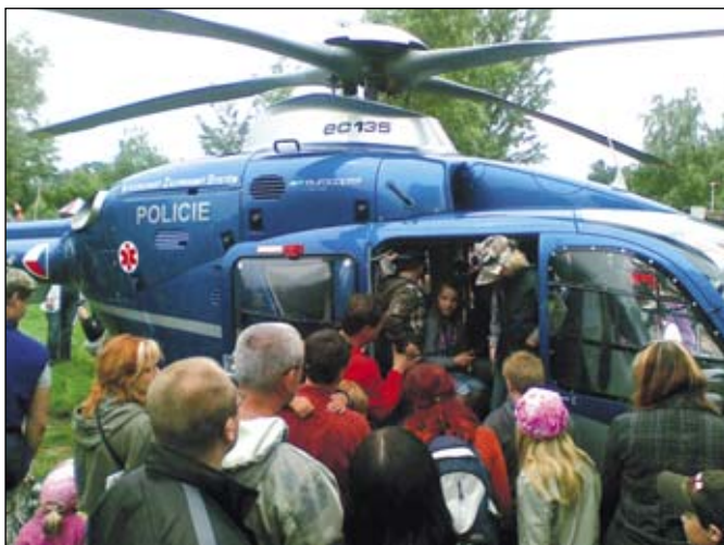
Doslova v obležení se ihned po přistání ocitl policejní vrtulník.

Práci jednotlivých složek Záchraného integrovaného systému představili záchranáři, hasiči, zdravotníci, ale především Policie České republiky v kempu pod breclavským zámkem. Přestože počasí zrovna moc nepřálo, zajímavý program akce nazvané IPA DĚTEM přilákal stovky rodin.