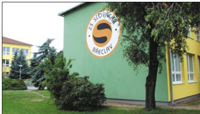
Základní škola Slovácká dostala konečně po mnoha letech nový kabát. Kromě vnější rekonstrukce bylo kompletně opraveno i sociální zařízení školy.