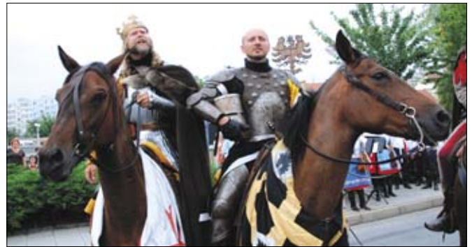
Jošt Moravský pozdravil breclavský lid.

Po odpolední ceremonii u Moravské Orlice, kdy všudypřítomně pozdravil Jošt Moravský a slovácký krůžek Charvatčané vystoupil s CM notečka. se centrem města vydal historický průvod, jehož cílem bylo hlavní centrum oslav, podzámčí. Ještě předtím však desítky mušketyřů vzdali hold mohutnou salvou.