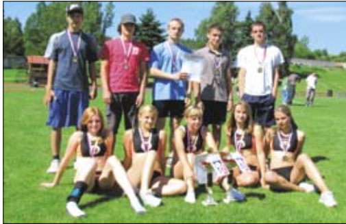
Čtyřbojaři ZŠ Slovácká na republice zvítězili