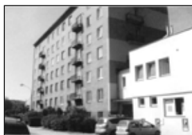
01525 BŘECLAV byt 2+1, OV, centrum 1,125 mil. Kč