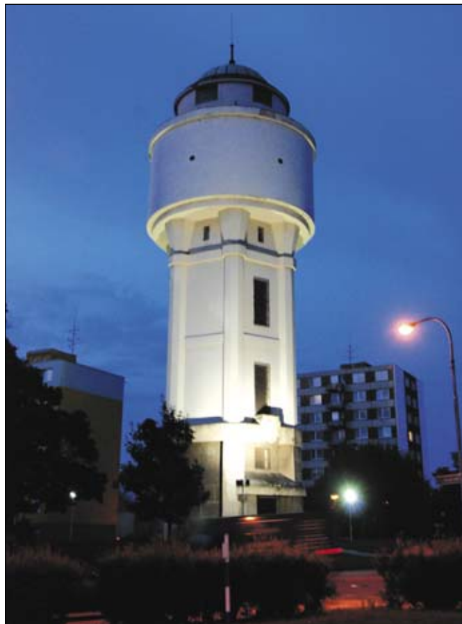
Jednou z investičních akcí je I. etapa osvětlení breclavských památek, v rámci které byl osvěten i vodojem. Ve fázi příprav je rekonstrukce židovské kaple.