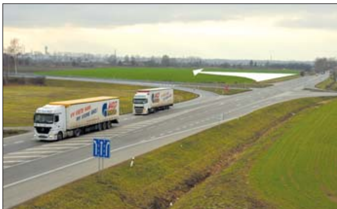
Šipka ukazuje na místo, kde již měla stát část obchvatu.

Důvodem jsou spory kolem silničního napojení z Brna na Vídeň, přesněji řečeno po rakouské hranici. Zatímco představitelé několika obcí a ekologové volají po využití stávající dálnice D2 z Brna do Břeclavi a k ní dobudování propojení ke státní hranici, Jihomoravský kraj i Rakušané počítají s rozšířením stávající komunikace z Brna do Mikulova. Obě varianty úzce souvisí s plánova-