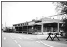
01535 BŘECLAV sklad, hala s rampou - pronájem

Příjemné prožití svátků Vánočních a všechno nejlepší do nového roku