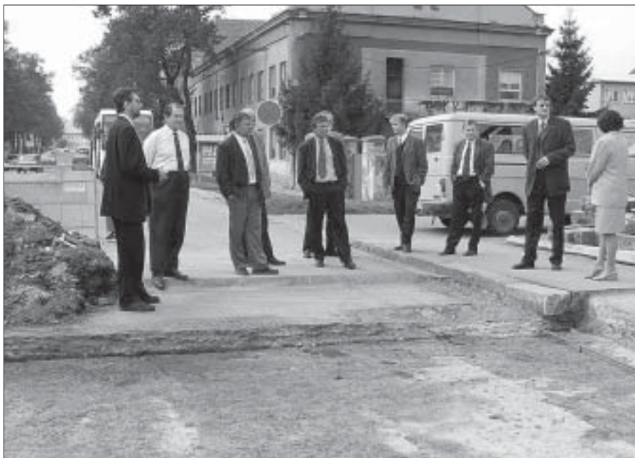
Ve středu 10. října se v Břeclavi uskutečnil slavnostní kontrolní den stavby rekonstrukce silnice I/55 v Břeclavi.

Do breclavského zámku už nemůže dešť, vítr ani bezdomovci. Domovní správa nechala zabezpečit okna proti povětrnostním i jiným vlivům, aby nedocházelo k dalšímu chátrání této historické památky. Domovní správa Břeclav chce ještě zabezpečit sítě otvory ve věžích a věžičkách proti holubům, kterých do zámku létají celá hejna. (peh)