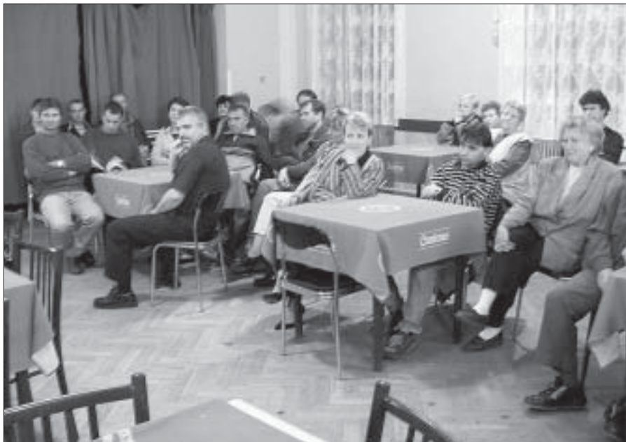
Vedení města podruhé v tomto volebním období besedovalo s občany městských částí o problémech, které je tíží.

Komerční kancelář Gumotex Opel Nešpor Firma Petružálek BORS Břeclav