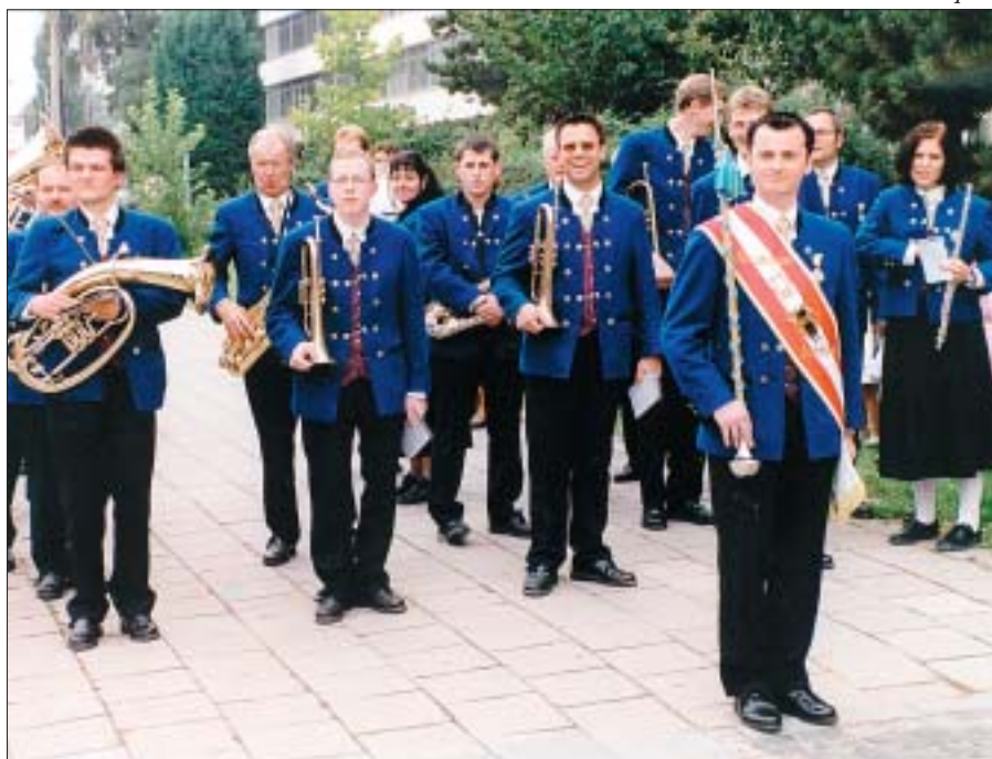
Břeclavské svatováclavské slavnosti přijel podpořit i soubor z rakouského partnerského města Zwentendorf.