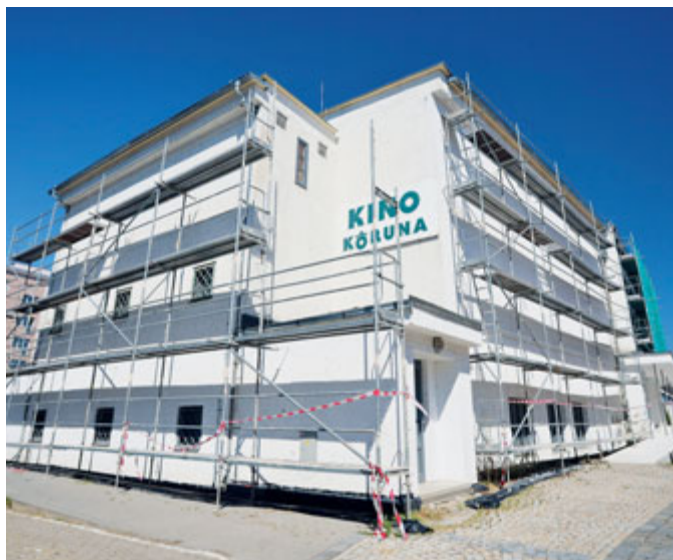
Kino prošlo rekonstrukcí. Návštěvníkům se otevře v polovině září.