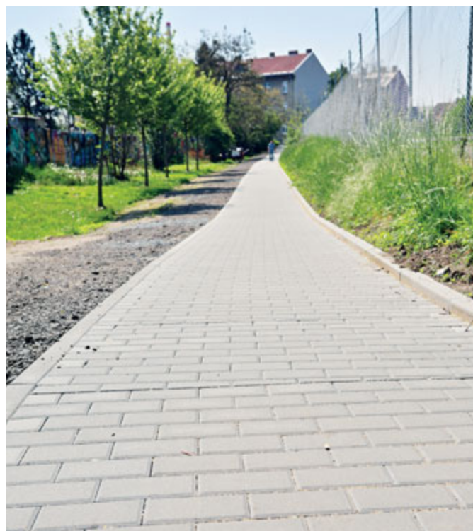
Důležitou spojovací uličkou pro Břeclavany je propojka za Moraviapressem.

nická a A. Kuběny v Ch. N. Vsi, chodník za Moraviapressem nebo cesta mezi ul. Kupkova a Veslařská.