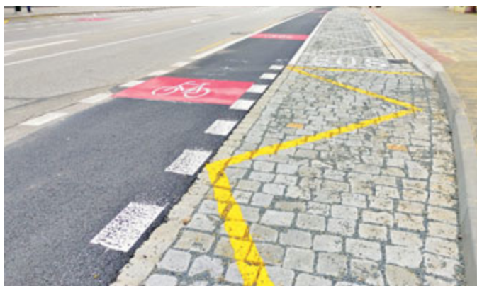
Nové autobusové zálivy pomohly plynulosti dopravy v Břeclavi i nástupním komfortu cestujících.

prostoru. Hlavním cílem bylo vytvoření bezpečného, přehledného a bezbariérového úseku a zvýšení bezpečnosti všech uživatelů. Úprava autobusové zastávky na náměstí T. G. Masaryka zahrnovala rekonstrukci autobusového zálivu, nástupiště a chodníkových ploch.