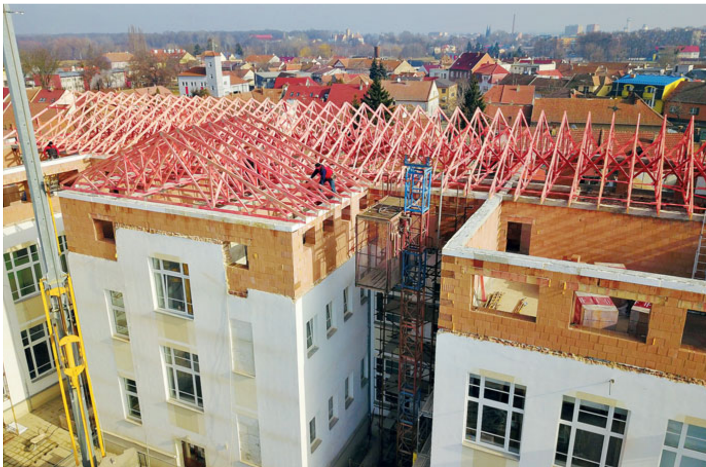
V roce 2020 město zahájilo budování odborných učeben na ZŠ Komenského.