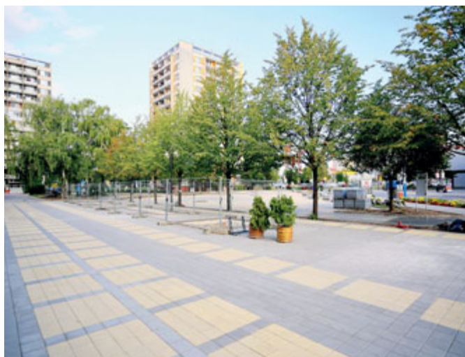
Další etapou pokračovala v roce 2021 revitalizace sídlíště J. Palacha.

valo ve výměně části svítidel (se zachováním stožárů) vybudovaných v rámci 1. etapy a výměně zbývajících částí stávajícího kabelového rozvodu stožárů a svítidel.