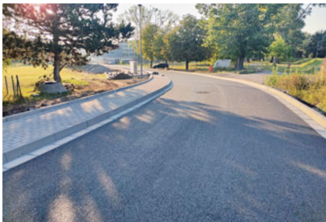
Komunikace mezi Pastviskem a Domovem seniorů prošla rekonstrukcí.

nové parkovací plochy a veřejného osvětlení. Následně přibude hřiště pro děti. Poté se začne s celkovou rekonstrukcí areálu Pastvisko.