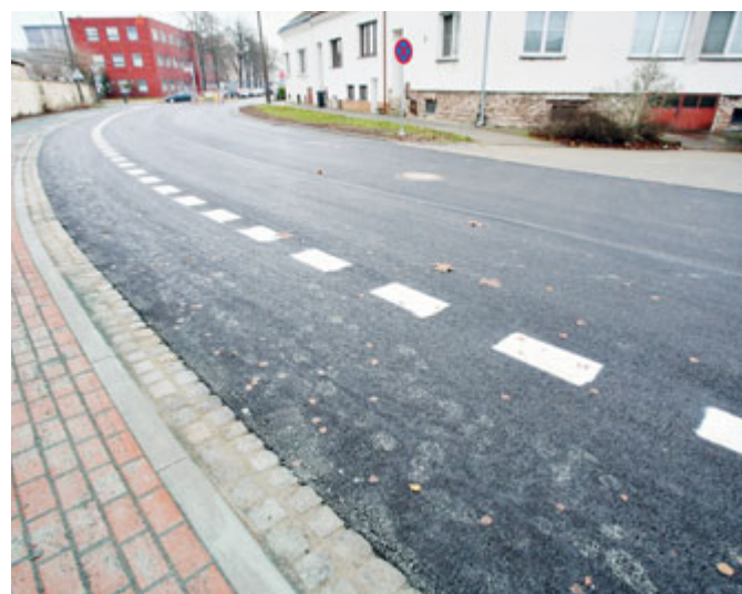
Součástí oprav ul. Mládežnická bylo vybudování podélných parkovacích míst.

ťovou kanalizaci. Součástí potřebných oprav a renovací hasičské zbrojnice byla výmalba toalet, které slouží pro návštěvníky hodů a dalších veřejných akcí, pořádaných Na Rovnici.