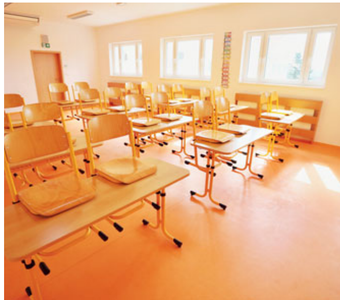
V poštořenské základní škole byly vybudovány nové odborné učebny.