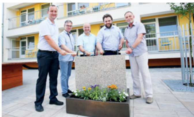
První etapa oprav Domova seniorů začala v červnu 2019.

Celá investice vyšla na cca 114,5 milionů korun, z toho 44 milionů získalo město z dotace od ministerstva práce a sociálních věcí. První etapa byla zkolaudována v prosinci r. 2020.