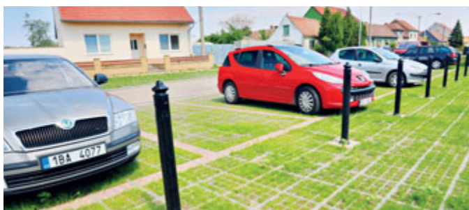
Nové zelené parkoviště vyrostlo i ve Staré Břeclavi.