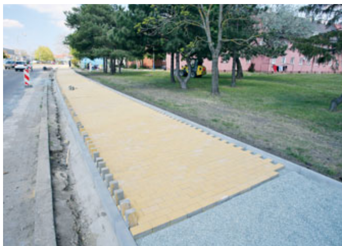
V roce 2020 jsme začali budovat další část cyklostezky podél ul. Bratislavská.

navrženy vzhledem k dopravnímu zatížení ulice v co možná největší míře bez výkopů.