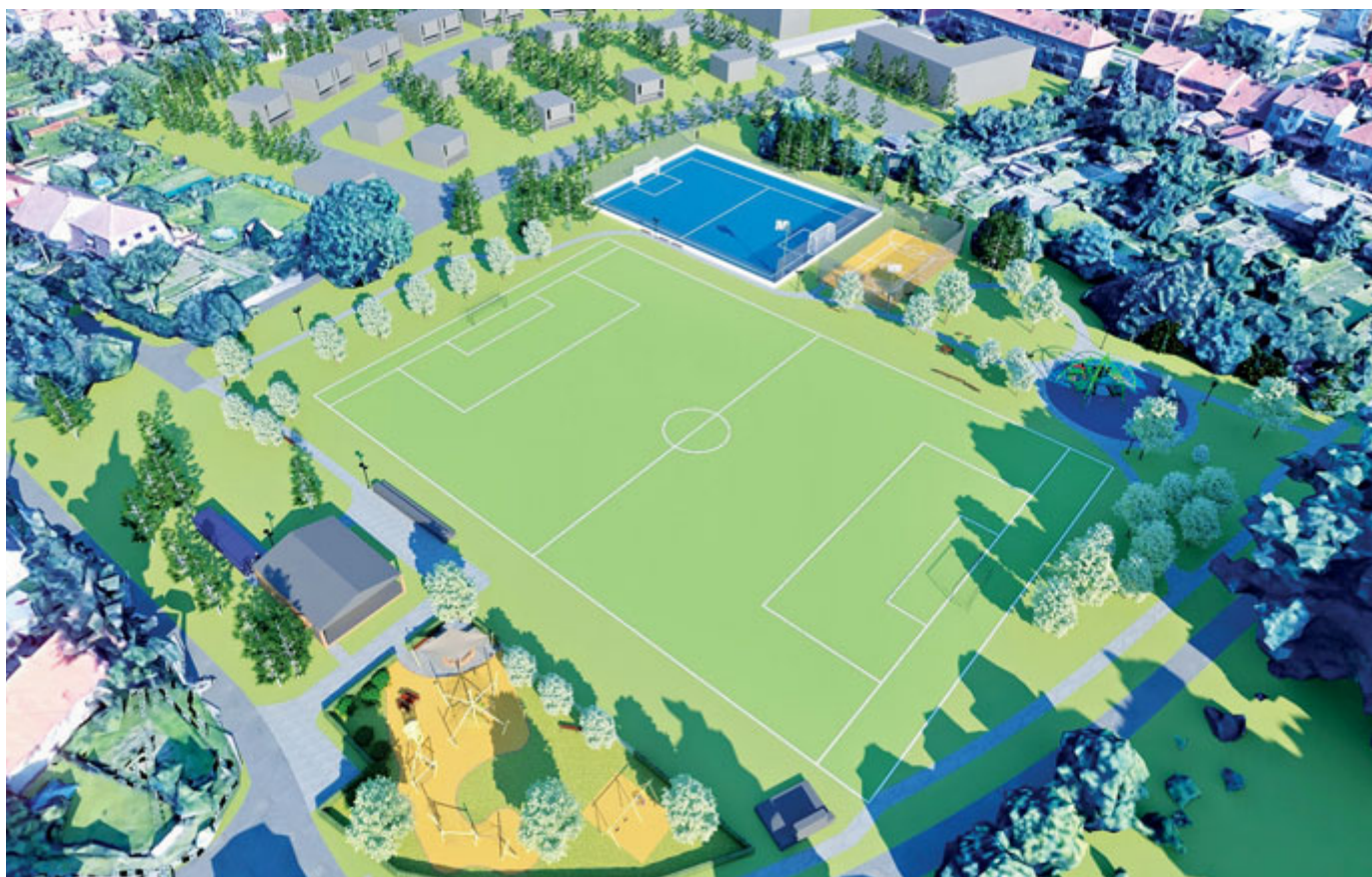
Rekonstrukce komunikace je prvním krokem k celkové revitalizaci areálu Pastvsko. To po opravách nabídne několik herních ploch včetně nového dětského hřiště.