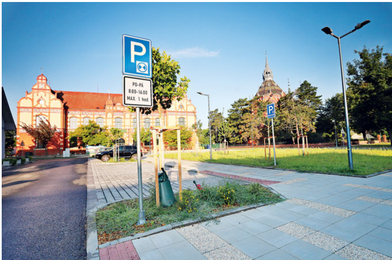
Zrevitalizovali jsme prostor před ZŠ Komenského. Přibyla i praktická parkovací místa pro návštěvníky poštorenské pošty.