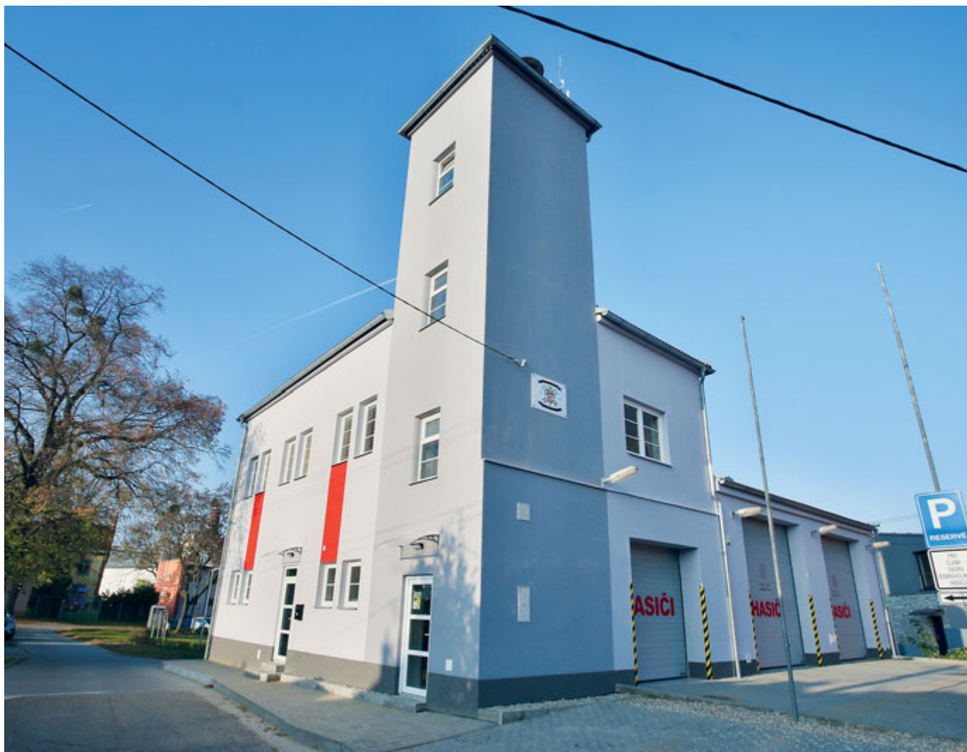
Statické zajištění, oprava prasklin, kompletní oprava fasády a dešťové kanalizace – poštorenská zbrojnice se dočkala renovace.