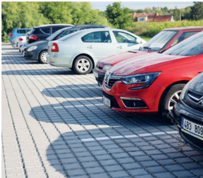
Na Valtické vybuďovalo město 71 nových parkovacích míst.