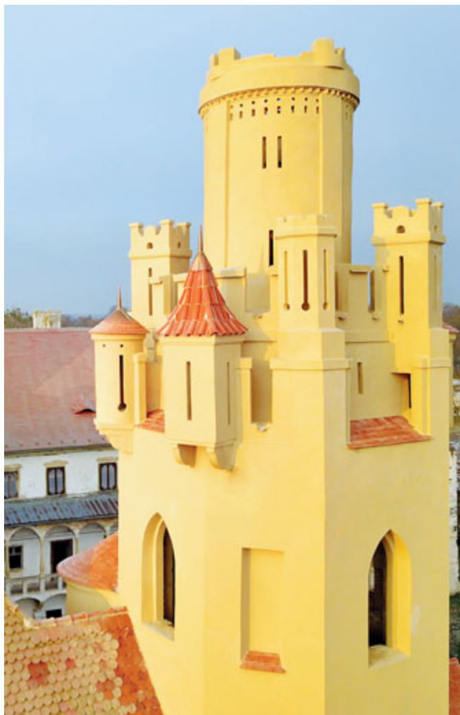
Břeclavský zámek postupně rekonstruuje. Opravili jsme jižní věž. V dalších letech chce radnice za pomoci dotací opravit i další části budovy.

V Charvátské Nové Vsi byla vybudována přírodní zahrada v MŠ Kpt. Nálepky. Co se týče mateřinek, byl čerstvě schválen výkup pozemku pro rozšíření školky na Hřbitovní ul. „Výkup pozemku na rozšíření školky ve Staré Břeclavi je jedinou možností, jak navýšit kapacitu předškolních zařízení. Břeclavské školky jsou plné a toto je způsob, jak to vyřešit. Věřím, že to rodiče ocení,“ uvedl místostarosta Jakub Matuška.