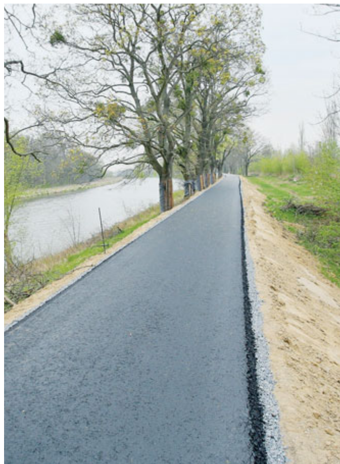
Díky další části cyklostezky mohou lidé bezpečně putovat od Pastviska až na konec Staré Břeclavi.

tezky, po které mohou bezpečně putovat od hřiště Pastvisko až na konec Staré Břeclavi.