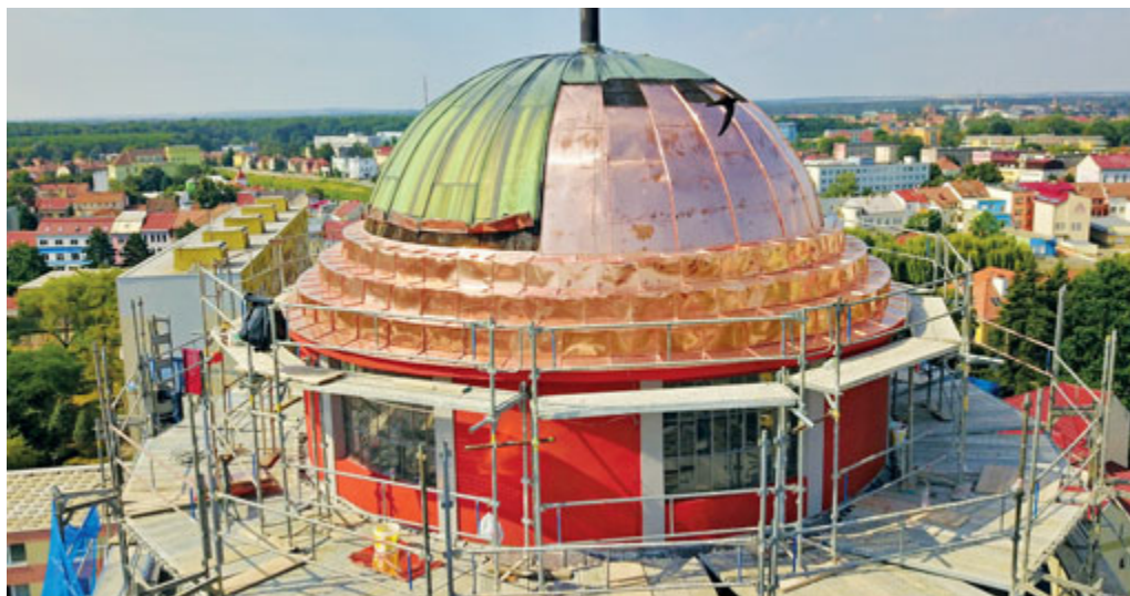
Zájemcům o pohled z výšky se letos otevře věž v sobotu 24. 9. na Svatováclavské slavnosti.

sundávat lešení. Dominanta Břeclavi, která byla vybudovaná v letech 1926 až 1927, svými bar-