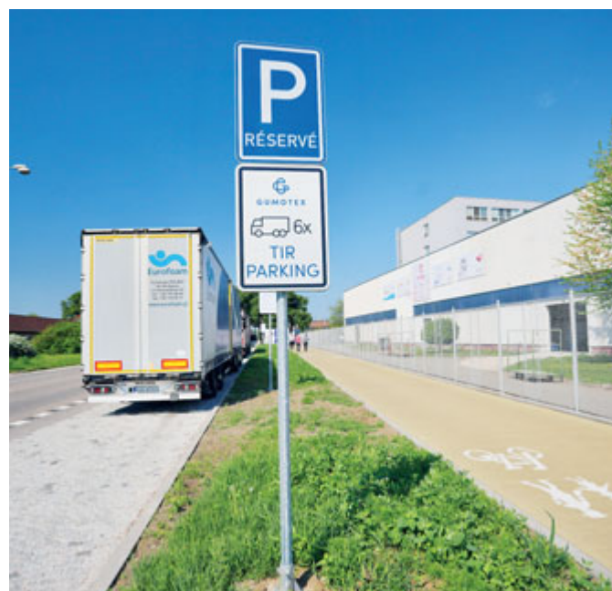
Podél nové cyklostezky vzniklo u Gumotexu také praktické parkování pro kamiony.

stáním pro nákladní auta, které vozí materiál do areálu společnosti Gumotex a.s.