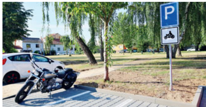
Parkoviště na nám. P. Bezruče bylo vybudováno s ohledem na stávající vzrostlé stromy v místě.

s úpravou zpevněných ploch vznikla nová kontejnerová stání. Parkoviště bylo vybudováno s ohledem na stávající vzrostlé stromy v místě.