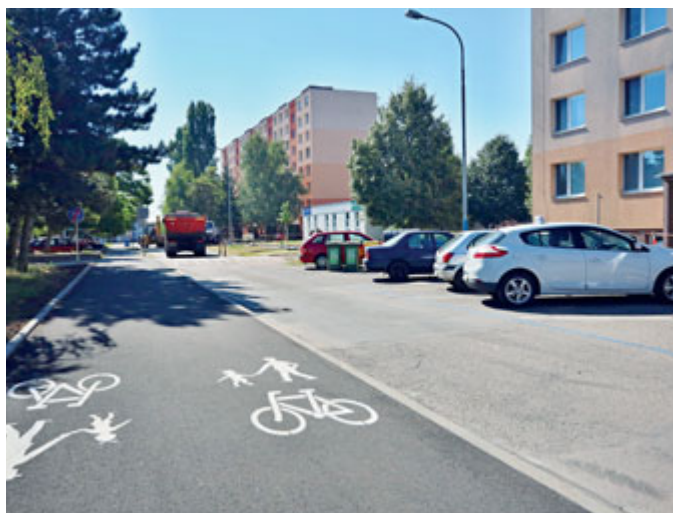
Mezi bytovými domy a školou na Slovácké ul. je vybudována bezpečná stezka pro chodce a cyklisty.

trasu. Chodníkové plochy byly navrženy tak, aby lépe reprezentovaly centrum Poštorné, vzhledem k tomu, že se nacházejí u historických budov. Novostavba parkoviště zvýšila komfort parkování u místní pošty. Výrazně se také zlepšila bezpečnost dopravy na ulici Osvobození.