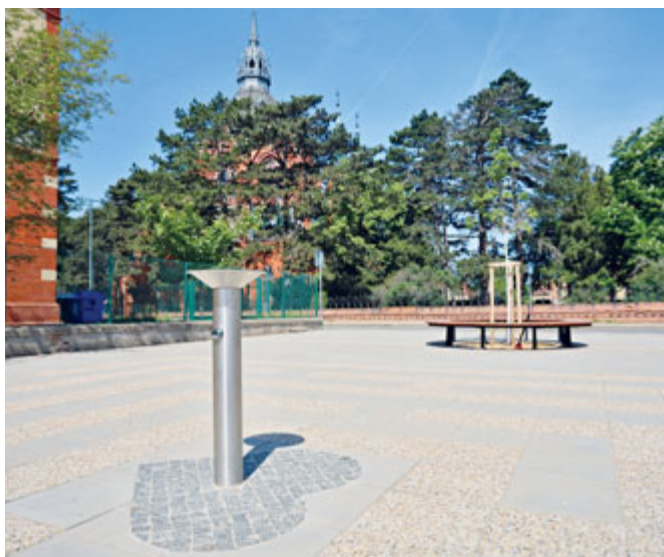
Před ZŠ Komenského vznikla odpočinková zóna, na které nechybí pítko.