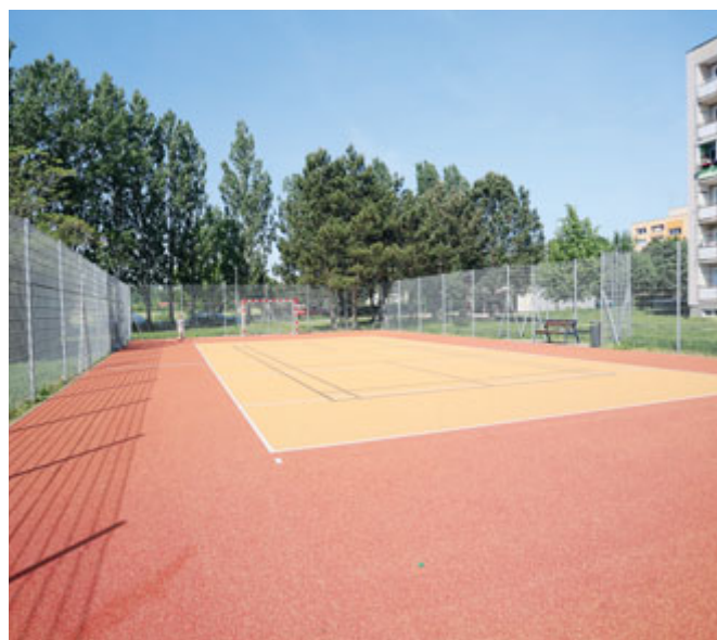
Po rekonstrukci sportovních hřišť u točny, která je hotova, přijde na řadu vybudování nového sportovního hřiště při ZŠ Na Valtické, ale také hřiště dětského.