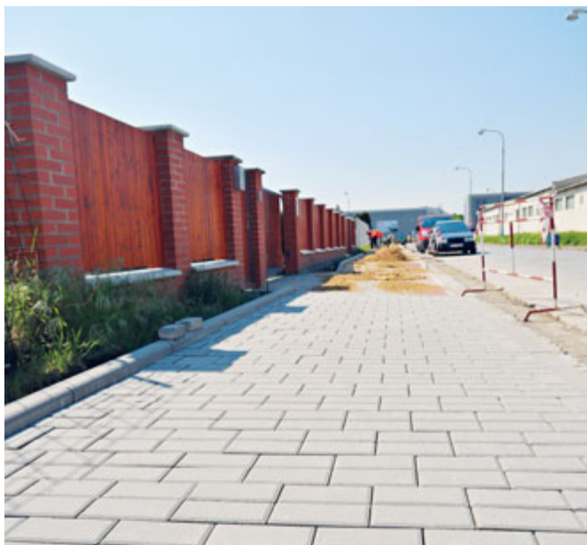
Chodník na Lanžhotské byl v půli května před dokončením.