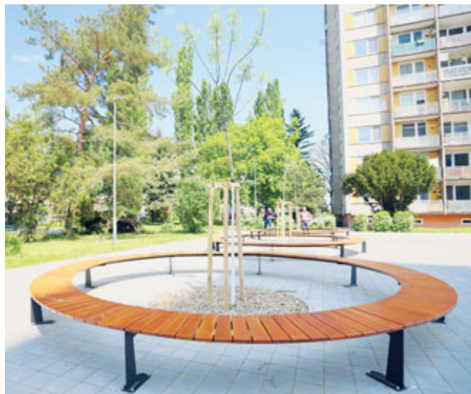
Na sídlišti Jana Palacha vznikly odpočinkové zóny a nové sportovní hřiště.

Revitalizace je naopak téměř u konce na sídlišti Jana Palacha, kde vznikly odpočinkové zóny se zelení nebo nové sportovní hřiště. Nyní se pracuje na dětském hřišti se snahou snížit jeho prašnost výsevem trávy