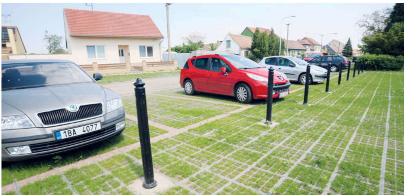
Ve Staré Břeclavi končí práce na kompletním ozelenění. Hotovo je parkoviště u parku.