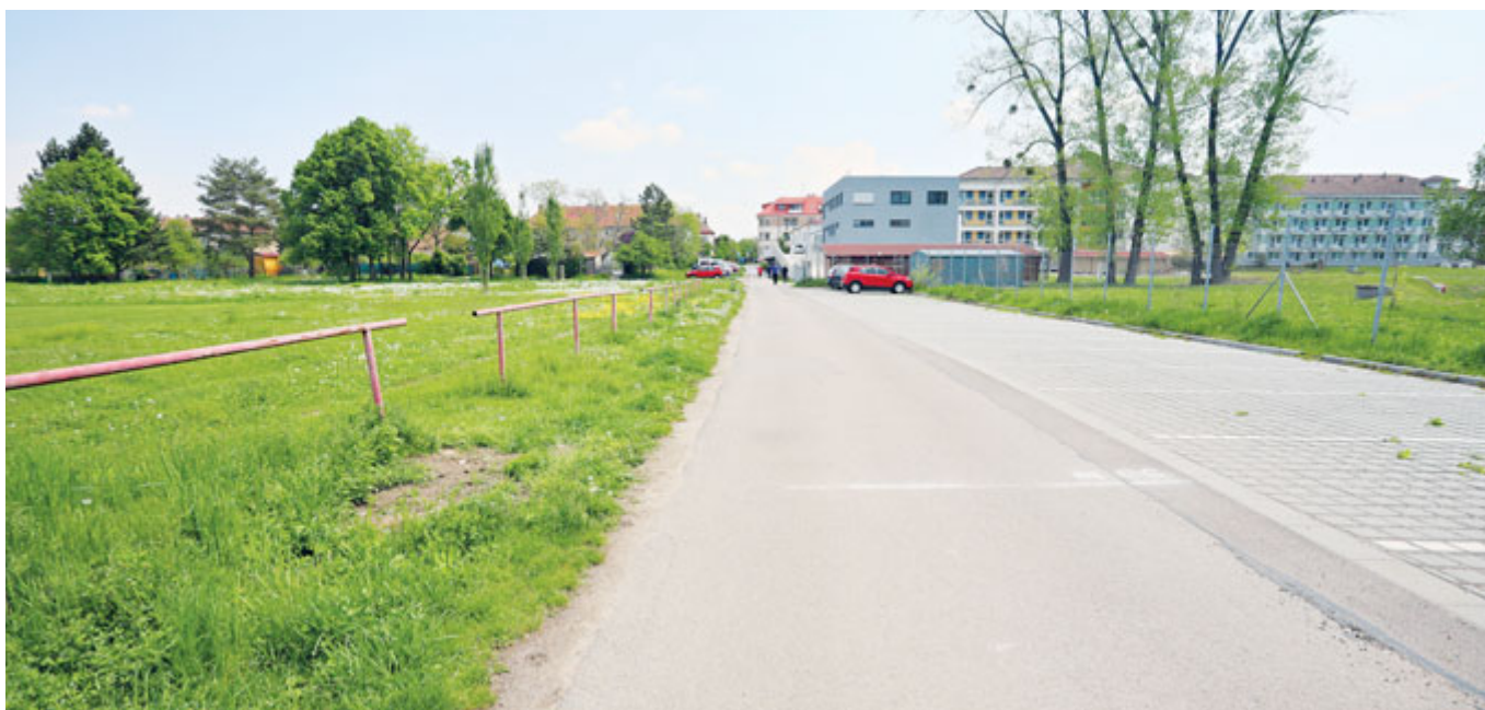
Začaly práce na rekonstrukci komunikace u Pastvicka, na které naváže revitalizace dětského hřiště s novými prvky.