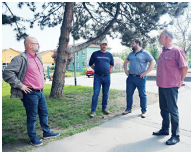
„Na Slovácké ulici vznikne společný chodník pro pěší a cyklisty, který zvýší bezpečnost pohybu dětí do a ze školy,” shoduje se vedení radnice.