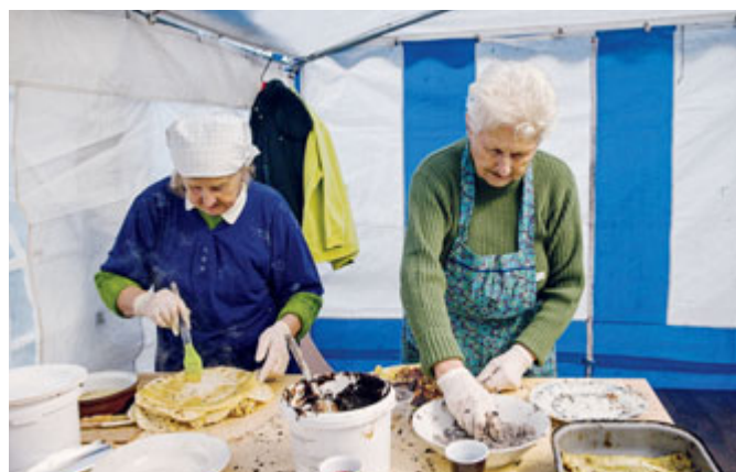
Na jarmarku v Poštorné nemohly chybět tradiční pljesňáky.