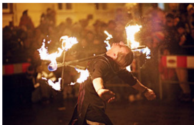
Ohňová show doplnila řinčící Krampusy.