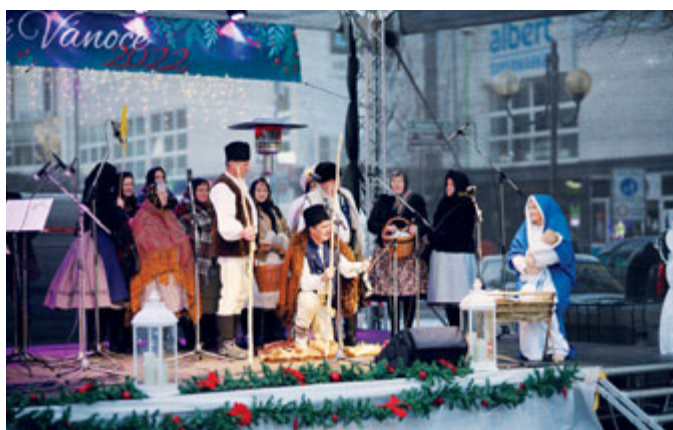
K Břeclavským Vánocům patří kulturní vystoupení, která navodí sváteční atmosféru.