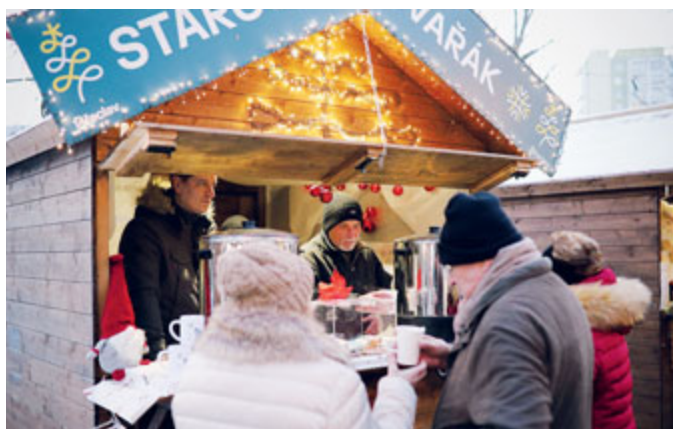
Starostův svařák vynesl bezmála 50 tisíc korun, které poputují na dobrou věc.