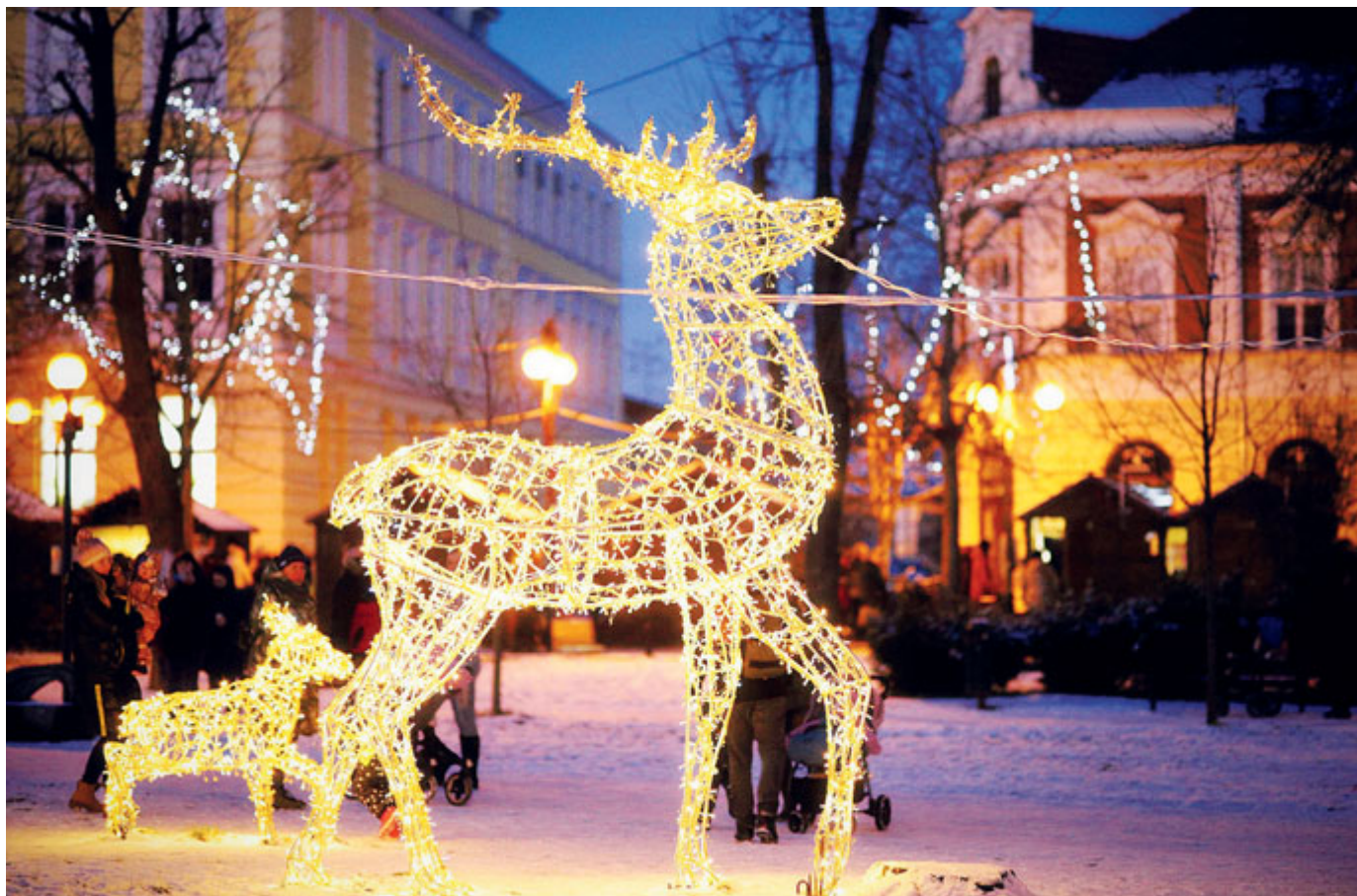
Vánočně nasvícený park byl po sněhové nadílce kouzelný.