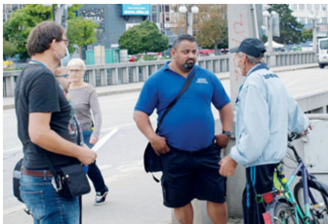
S Asistenty prevence kriminality má městská policie v terénu výborné zkušenosti.

Největší změny v rámci řízení a činnosti MP se datují k roku 2012. V té době byla změněna organizační struktura MP, byly zavedeny pozice strážníků s územní a objektovou odpovědností – okrskářů. Město bylo rozčleněno na 5 částí – okrsků. Byl také zřízen nový městský kamerový systém, který je obsluhován nonstop. MP začala celkově spravovat parkovací systém, zajišťuje ztráty a nálezy, prevenci kriminality (dětské dopravní hřiště), projekty prevence kriminality atd. Došlo k modernizaci technologií využívaných strážníky, k rozšíření a zkvalitnění vozového parku.