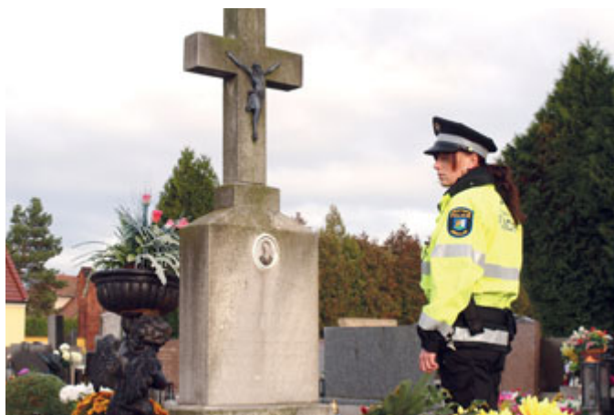
Strážníci Městské policie Břeclav hlídají v ulicích celého města. A když je potřeba, tak dohlíží i na hřbitovy, kde je riziko vandalství zvýšené např. na Dušičky.

znatky z oblastí, v nichž se lidé staršího věku dlouhodobě často ocitají v postavení snadných a do důsledku vzato zbytečných obětí. Důvody jsou dva: přílišná důvěřivost a nedostatek informací. Zatímco ke korigování důvěřivosti mohou strážníci nabádat, informace mohou skutečně předávat nebo jejich předání zprostředkovat. Městská policie má za to, že více v aktuálních problémech orientovaný senior rovná se senior sebevědomý, který svůj věk nechápe jako handicap, ale výhodu.