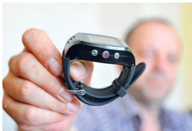
SOS hodinky používá v Břeclavi sedmdesát seniorů. V praxi už se osvědčily mnohokrát.

SOS hodinky provozuje mezi břeclavskou seniorskou komunitou městská policie od konce roku 2015. Za tu dobu strážníci absolvovali mnoho ostrých výjezdů, při nichž se senior ocitl ve svém bytě v nouzi. V několika případech bylo třeba poskytnutí první pomoci a převoz seniora záchrannou službou do nemocnice, ve zbylých postčila osobní pomoc městských policistů v bytě seniora, který např. upadl na zem a kvůli špatné pohyblivosti nebyl schopen se sám znovu postavit na nohy.